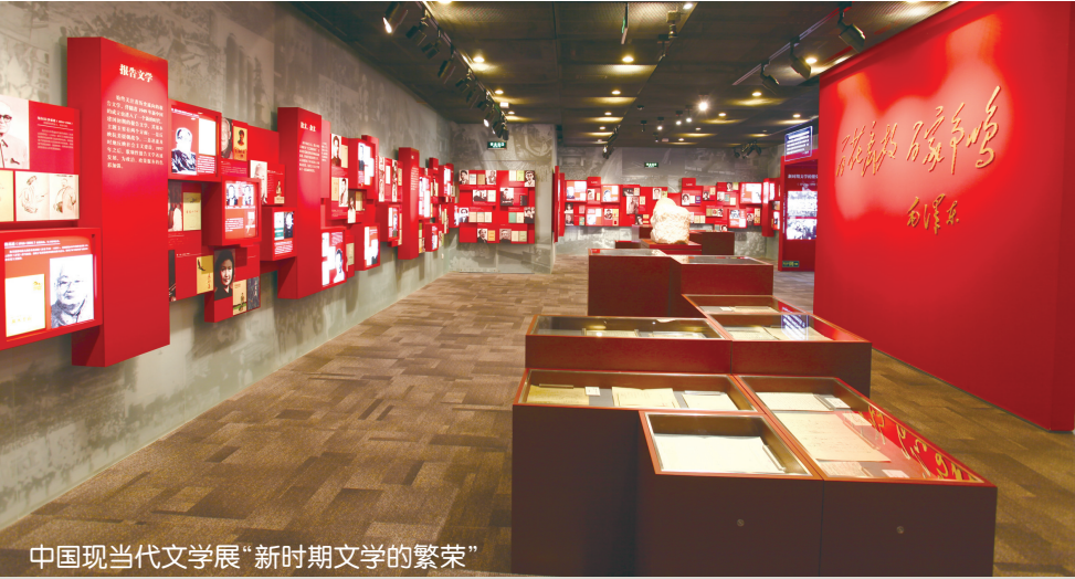
中国现当代文学展“新时期文学的繁荣”

走进展厅,文学大师们的肖像在高清屏幕上渐次浮现,左转进入展览的第一部分,一座立体人像出现在眼前,标志着新的文学时代的开