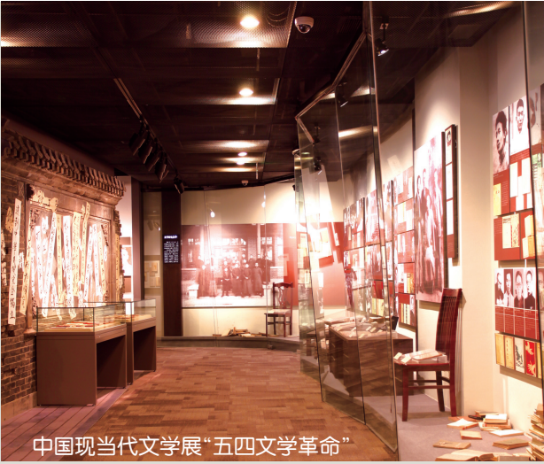
中国现当代文学展“五四文学革命”