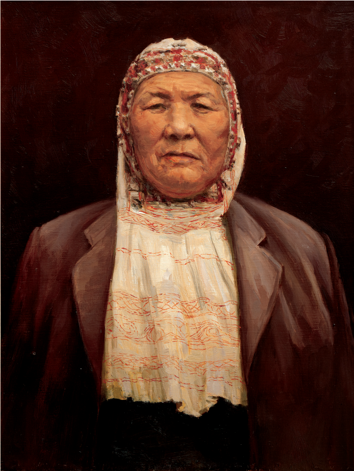
哈族妇女主任(布面油彩 80x60cm) 张祖英 作