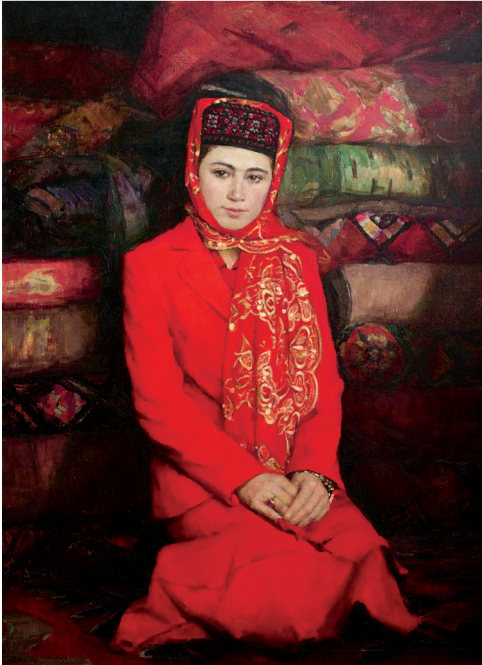
穿红衣服的塔吉克姑娘(布面油彩 135x100cm)