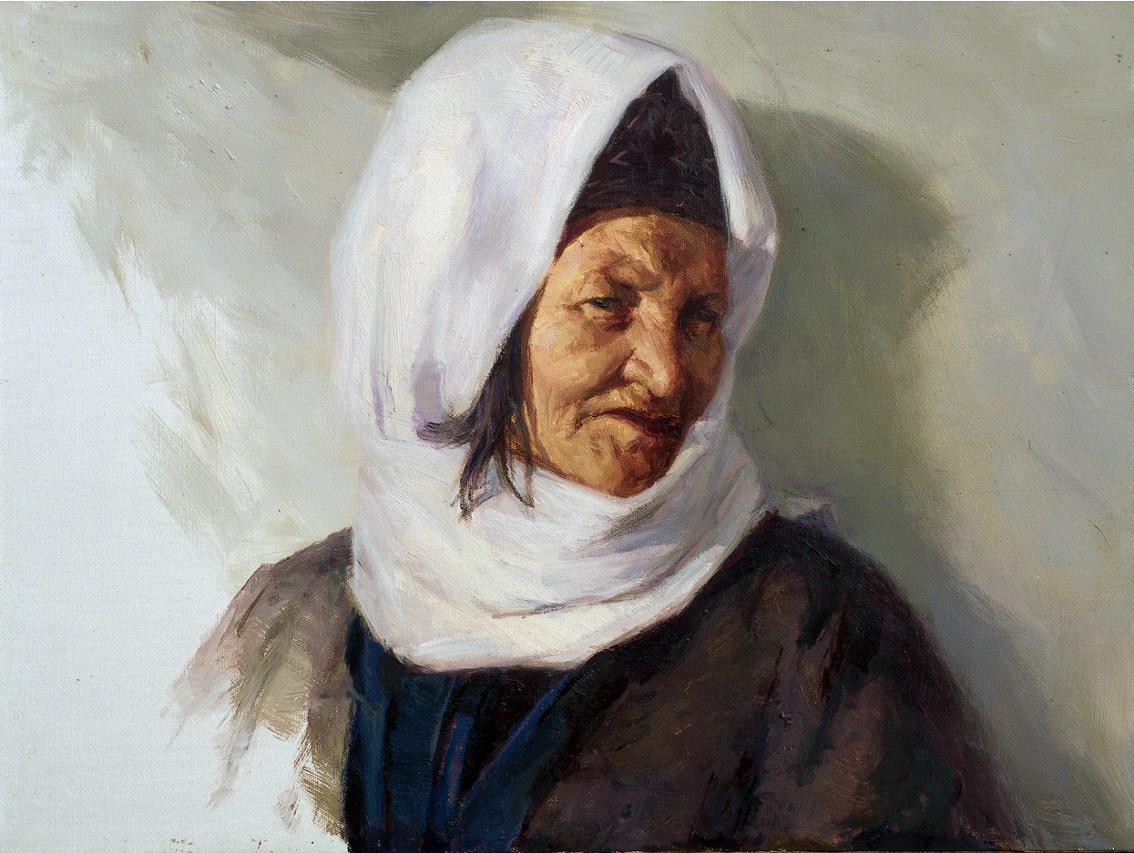
巴依夏大婶(布面油彩 80x60cm)