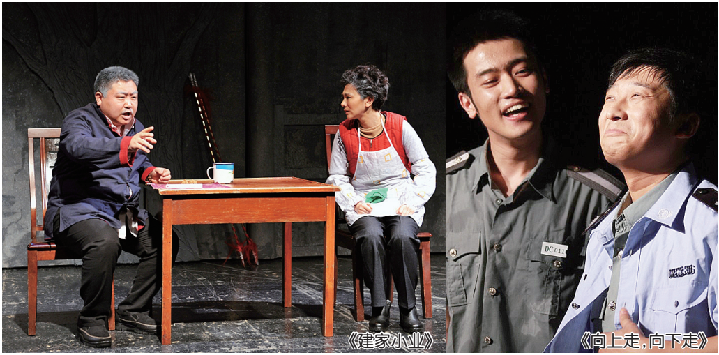
2013 全国小剧场戏剧优秀剧目展演——

吴善璋的受二王颜真卿的影响大一些,似乎他们给予了他更多的营养和精神上的支撑。读吴善璋的字,还常使我联想到郑板桥画笔下的竹叶,一枚枚,既有妍美迤丽的飘逸感,同时又仿佛是一把把锋利无比的小匕首,而不失力量。他的笔法变化多端,他让柔