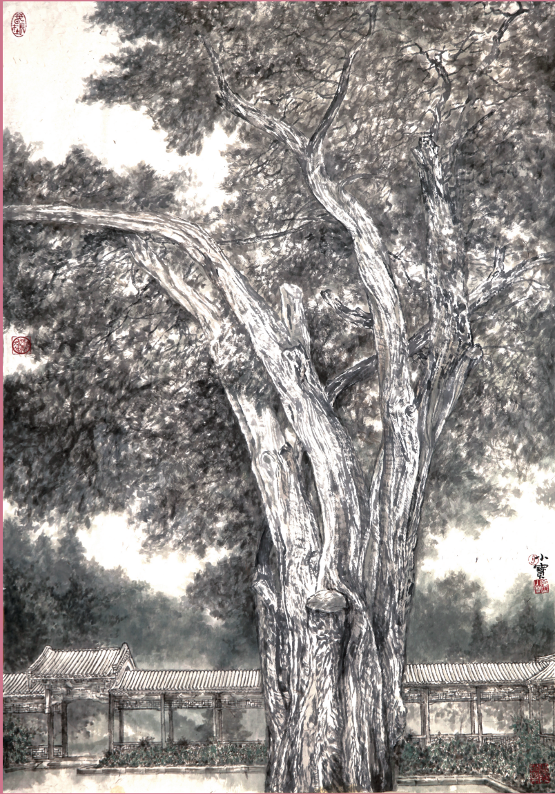
古柏积翠浓(纸本彩墨) 仓小宝 作