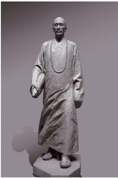
“春华秋实——曹春生从艺60年作品展”9月10日在中国美术馆开展,展览由中国美协、中国美术馆、中央美术学院、全国城市雕塑建设指导委员会艺委

会、中国艺术研究院中国雕塑院、中国雕塑学会主办。展览共展出曹春生自20世纪70年代以来创作的雕塑作品近60件,以及从1953年以来的各种绘画作品100多幅。