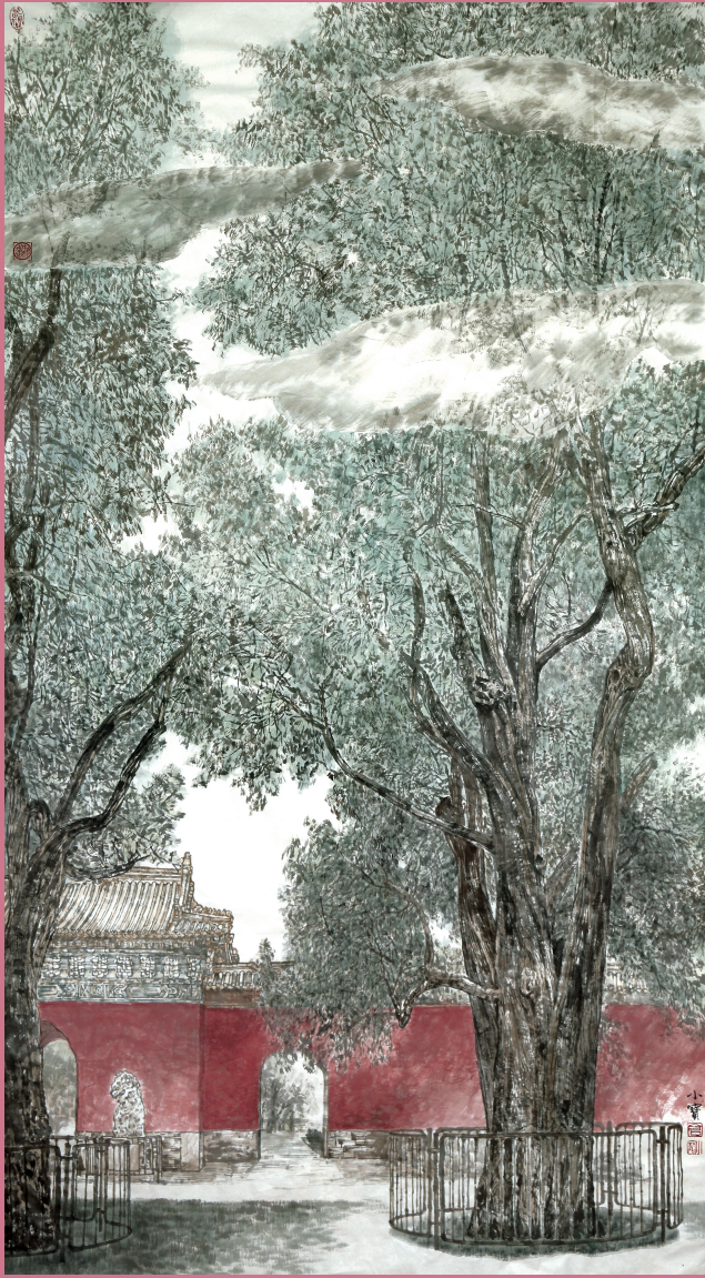
古都新绿(纸本彩墨)