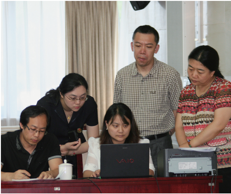
计票工作在纪律监察组和公证员的监督下进行