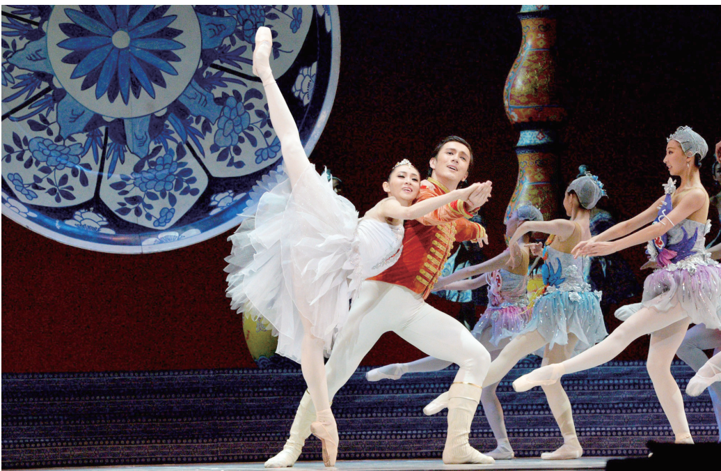
10月23日,第十届中国艺术节“文华奖”参评参演剧目、由中央芭蕾舞团创作的芭蕾舞剧《过年》在山东潍坊大剧院上演。图为除夕夜的圆圆怀抱胡桃夹子梦到了瓷器王国里的鹤神和胡桃夹子翩翩起舞。该剧融入了许多中国文化元素,向观众展示了一幅中国民俗风情画卷。