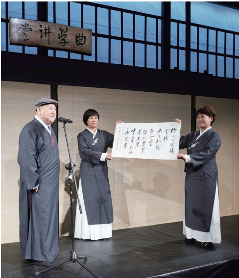
青音班结业典礼上尚长荣赋诗