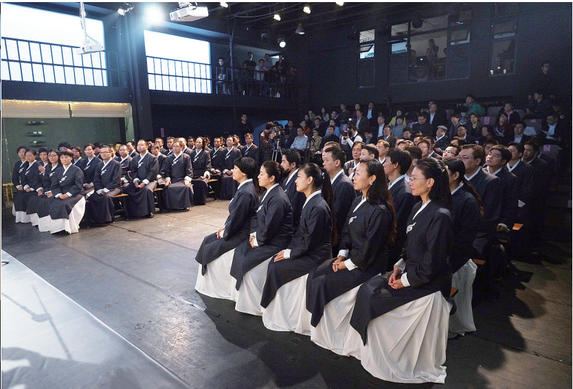
青音班结业典礼学员仪式

数月,短的可能才几天,但多数是学完了,也就画上了结业的句号,培训之后的跟踪、追问基本上没有,中国剧协青研班的可贵之处就是主办方对学员创作成果的跟踪与合作平台的搭建。从能否入选青研班到毕业后的表现,都要拿作品说话,研修班的毕业生每年带着新作回娘家一次,主办方为剧作家、导演、音乐家搭建聚首、合作平台,有力推动了新作品的问世。