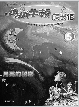
《小小牛顿成长馆》 台湾牛顿出版公司 编著 广西师范大学出版社 2013年7月出版