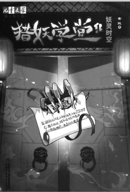
《猎妖学堂》 常 聪 著 中国少年儿童出版社 2013年7月出版