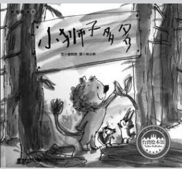
《小狮子多多》 谢明芳 著 福建少年儿童出版社 2013年7月出版

该书是一本引人入胜、与众不同的书，作者用简朴的语言，创造了一个崭新的、散文般的、充满了哲学智慧的阅读空间。