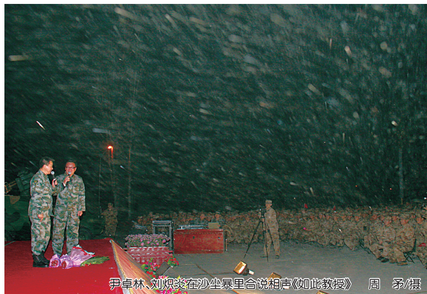
尹卓林、刘焯炎在沙尘暴里合说相声《如此教授》

立榜样、鼓励先进,进一步激发广大文艺工作者的积极性创造性,更好地发挥军队文艺工作的职能作用,总政治部有关部门决定,通报表彰20个“军队文艺工作者走基层”活动先进集体和41名“军队文艺工作者走基层”活动先进个人。通报要求受表彰的集体和个人,发扬成绩,珍惜荣誉,再接再厉,不断取得新的进步。全军广大文艺工作者要以他们为榜样,强化使命担当,发扬优良传统,积极投身强军兴军的火热实践,广泛开展以中国梦强军梦为主题的文艺创演活动,争当繁荣发展先进军事文化的排头兵。(王振江)