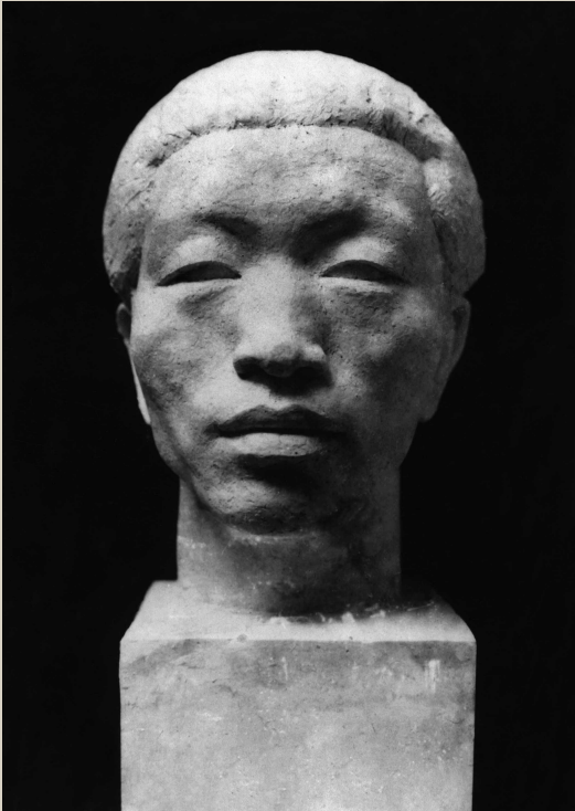
戏剧家李朴园(石膏),1935年创作于杭州