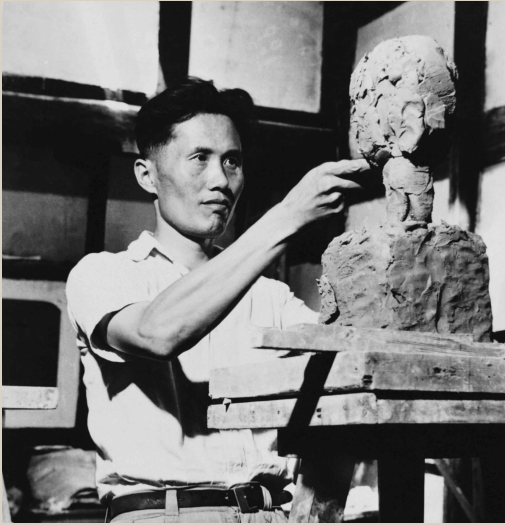
20世纪40年代初,刘开渠在成都的工作室中