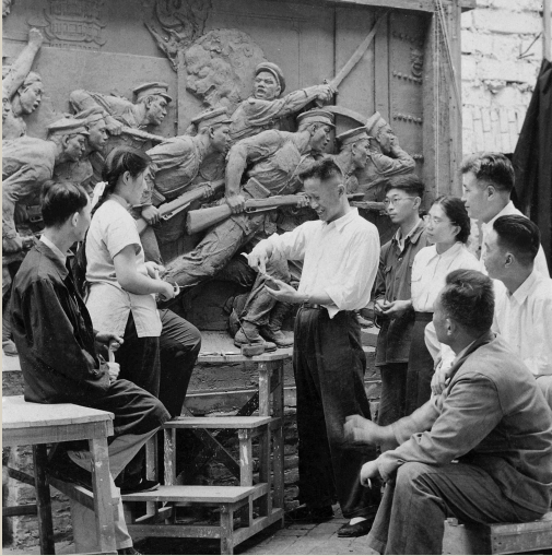
1956年,在人民英雄纪念碑前。左三为刘开渠