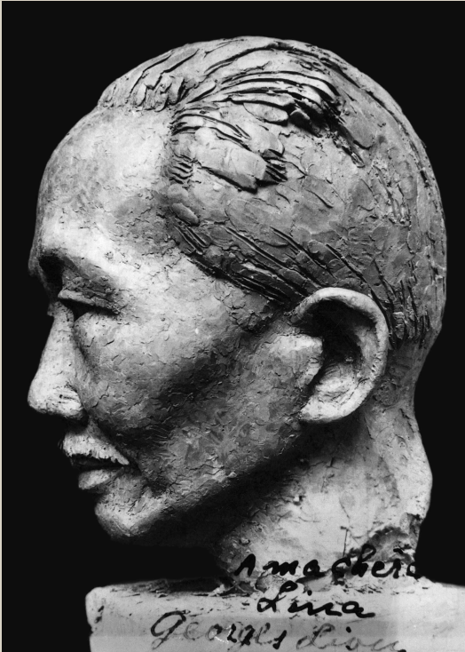
蔡元培头像(泥塑),1935年创作于杭州

王劲松在真诚地参悟书法之道,由心而书水墨之象。文化入境,生活为墨,心灵为笔。这是他对书法的理解,也是他行走的姿势与目标。他的从容、自然、内秀,以及对书法的心灵悟化和虔诚淡泊的追求,成就了他的书法,也在书坛上流动成一道风景。