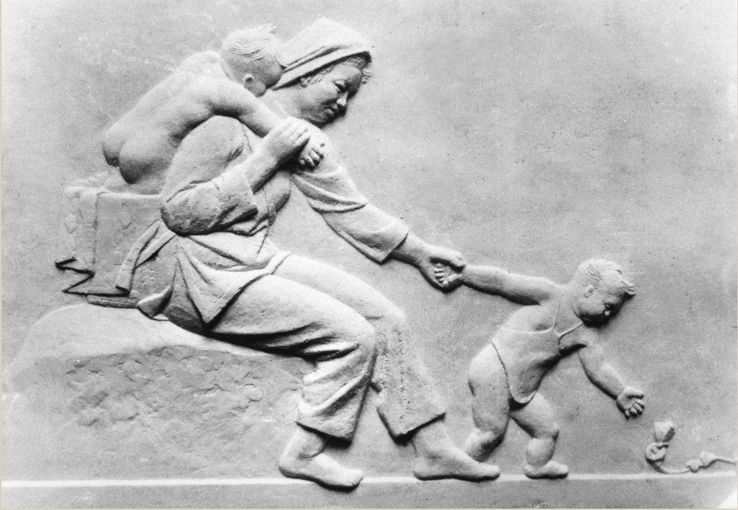
母与子浮雕(石膏),1934年创作于杭州

“开渠百年——纪念刘开渠诞辰110周年展”基于广泛调查和深入研究,精选了刘开渠最具代表性的51件雕塑作品和珍贵的历史文献资料,分为四个单元:“为现代中国人造像(1914—1949)”、“立民族之碑(1949—1978)”、“向新时代致敬(1978—1993)”和“世纪回望”。这四个相对独立的单元呈现了他的艺术人生,并突出地介绍了他为中国美术事业所作出的杰出贡献。