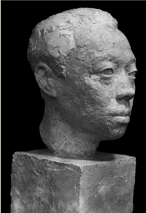
雷圭元像(石膏),1935年创作于杭州

在中国美术事业、中国雕塑事业、中国美术馆事业的开拓者和奠基人,人民艺术家、美术教育家、社会活动家刘开渠110周年诞辰之际,近日,“开渠百年——纪念刘开渠诞辰110周年展”在中国国家博物馆开展。此次展览由中华人民共和国文化部主办,中国国家博物馆和刘开渠艺术研究院承办,中国美术馆、中央美术学院、中国美术学院、安徽省淮北市人民政府、全国城市雕塑建设指导委员会和中国国家画院联合协办。