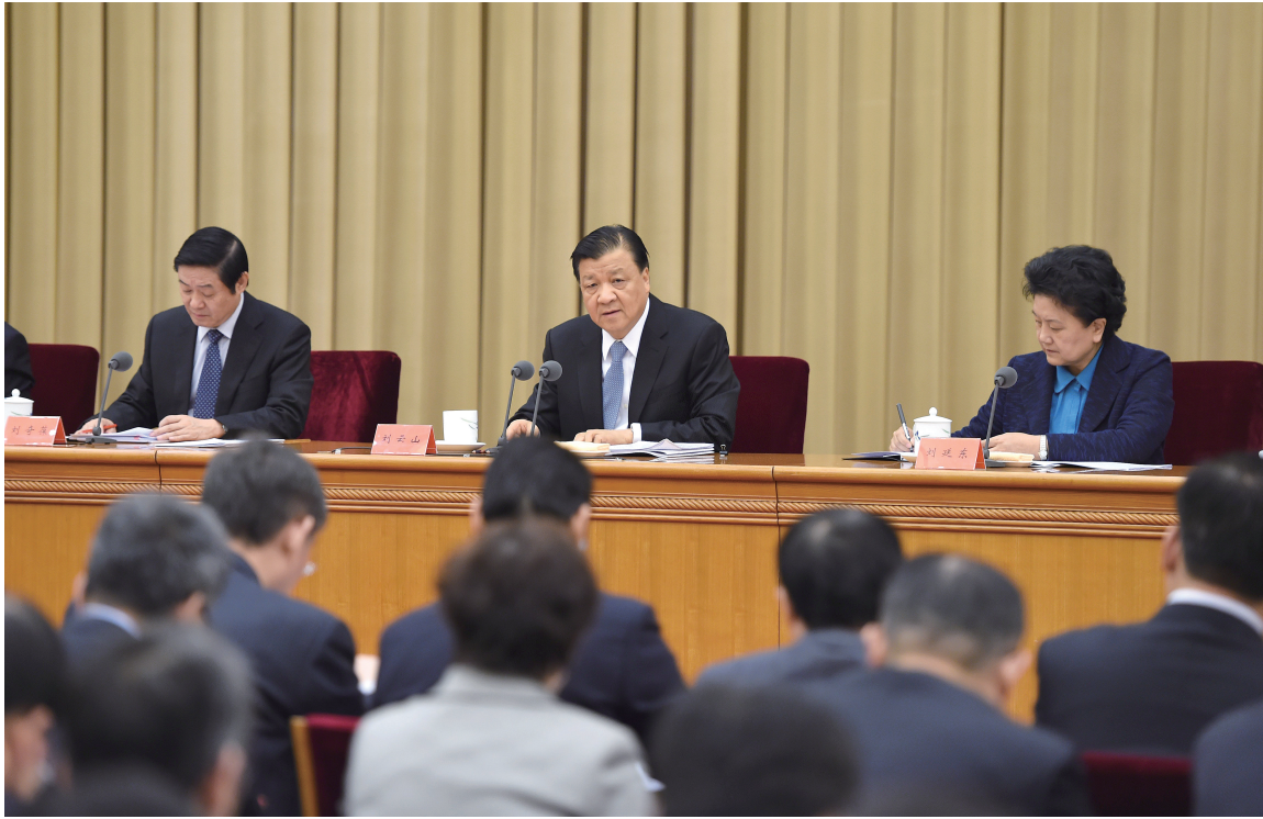
1月5日,全国宣传部长会议在北京召开。中共中央政治局常委、中央书记处书记刘云山出席并讲话。

议并作工作部署,强调要把握正确导向、坚持价值引领、讲好中国故事、强化依法管理、奋力创新求进。要深入学习宣传贯彻习近平总书记系列重要讲话精神,深化中国特色社会主义和中国梦学习宣传教育;强化党委领导意识形态工作责任制,牢牢掌握意识形态领域的领导权主动权;推进社会主义核心价值观学习教育实践具体化系统化,努力在全社会形成共同的价值