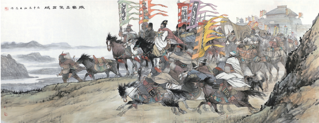
张骞通西域(中国画) 刘大为 作