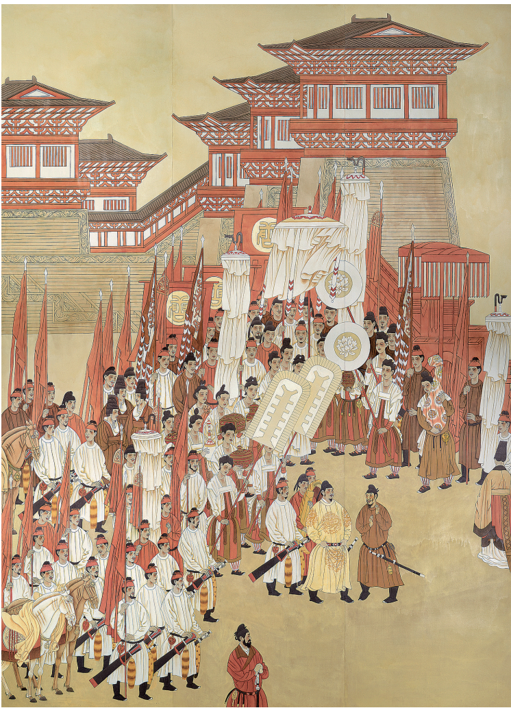
唐太宗纳谏(中国画) 杨晓阳 作