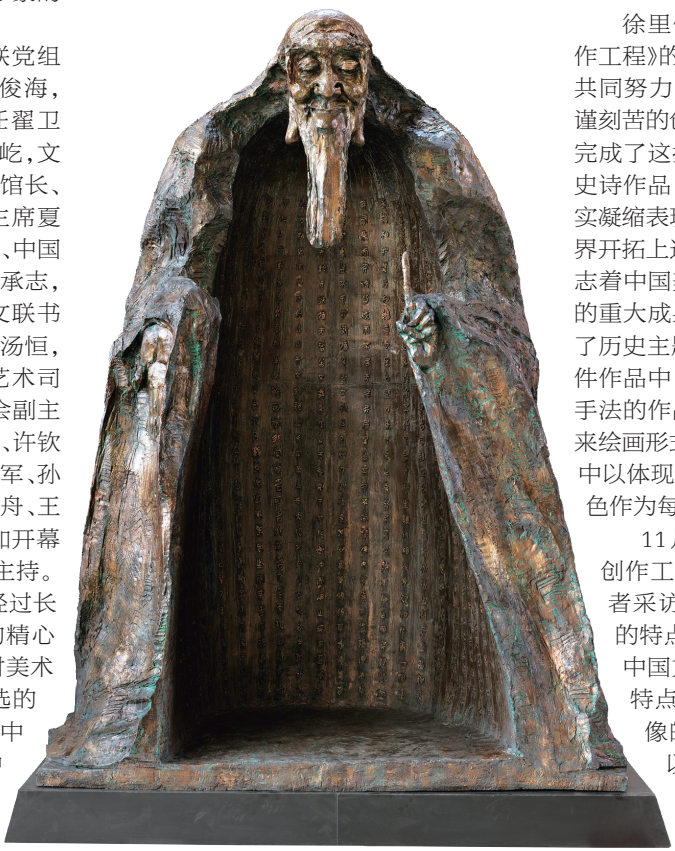
老子与《道德经》(雕塑) 吴为山 作

更好地理解和把握中华民族所走过的独特道路和所尊崇的精神价值,更加坚定文化自信,理直气壮迈向未来。参加此次创作的美术家以强烈的历史责任感、文化使命感和严肃认真的创作态度,认真研究历史典籍资料,深入把握历史选题的表现切入点,不断强化对历史文化内涵的认识,将自身对中华文明的思考和对艺术品格的追求,融入呈现历史风云、画说文明进步、传颂中华经典、彰显中国气派的艺术表达之中,以匠心独运的构思和精湛的造型艺术语言,催生了一大批具有极大思想震撼力和艺术感染力的中华美术精品,这些优秀的艺术作品标志着中国美术在历史画创作领域取得的重大成果和达到的艺术、学术高度,弥补了历史主题性美术创作的空白和缺憾。146件作品中,不光中国绘画、雕塑等各类形式手法的作品丰富、饱满且具张力,即便是外来绘画形式的油画艺术,也在此次创作过程中以体现应有的本土化、民族化、中国化特色作为每个作者的自觉追求。