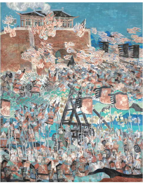
火药的发明应用(中国画) 张培成 作