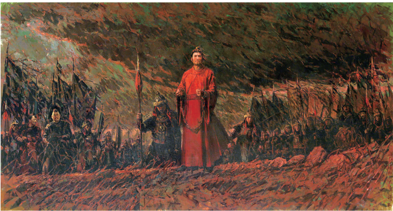
天地悠悠——文天祥过零丁洋写照(油画) 许江 邬大勇 孙景刚 作