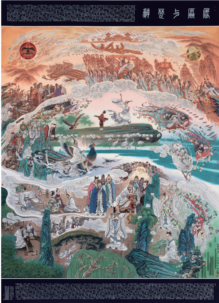
屈原与楚辞(中国画) 冯远 作