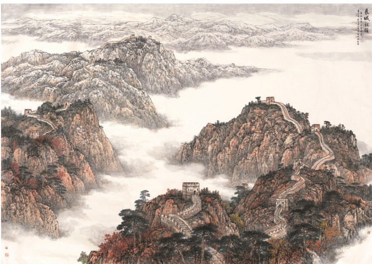
长城秋韵(中国画) 王明明 李小可 庄小雷 徐卫国 作