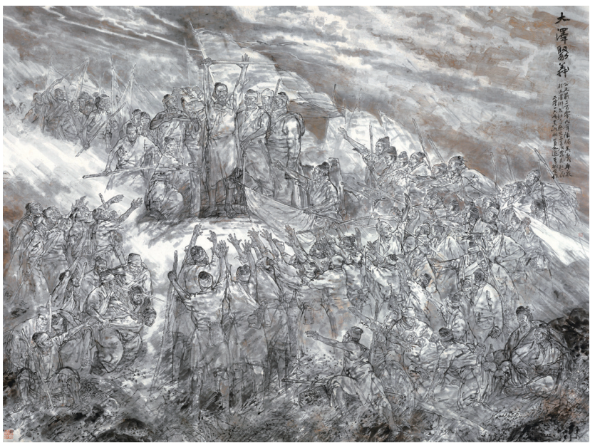
大泽聚义(中国画) 吴山明 董文运 李桐 作

第二,现实主义精神与写实主义、浪漫主义、表现主义等诸种艺术形式充分兼容互补的特点。现实主义手法的历史画创作注重细节对象和生活内容的“真实”和表现