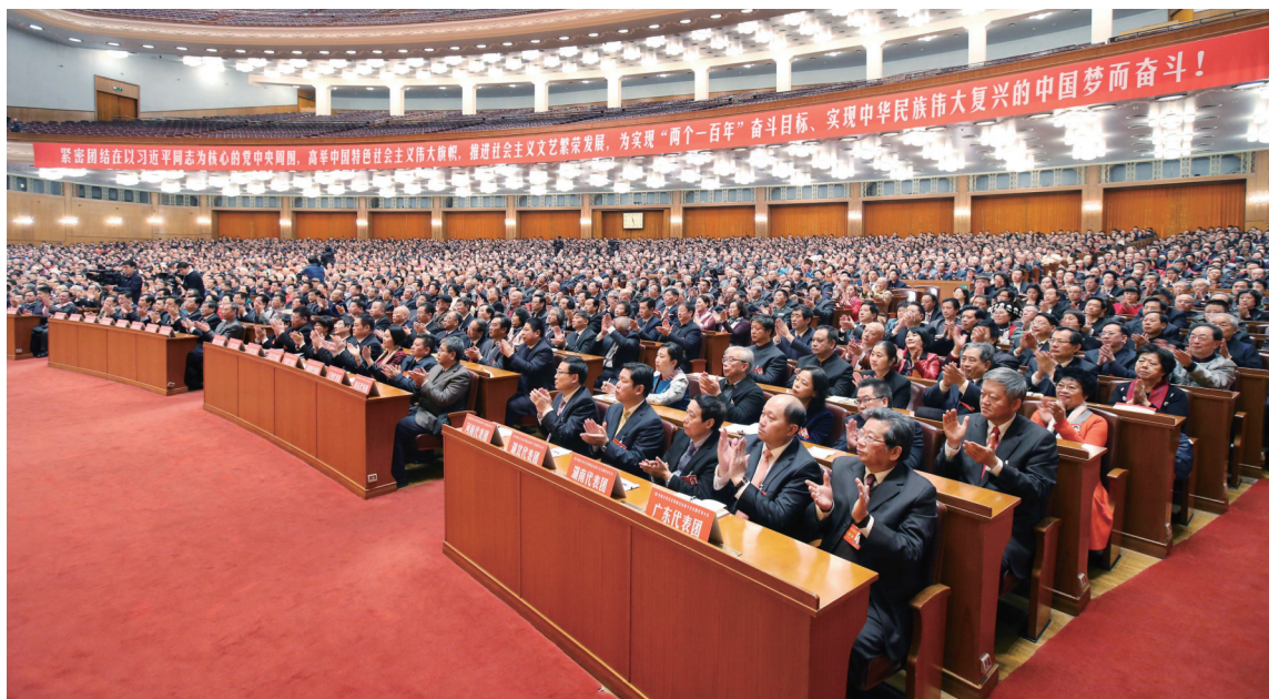
十一月三十日,中国文学艺术界联合会第十次全国代表大会、中国作家协会第九次全国代表大会在北京人民大会堂开幕。