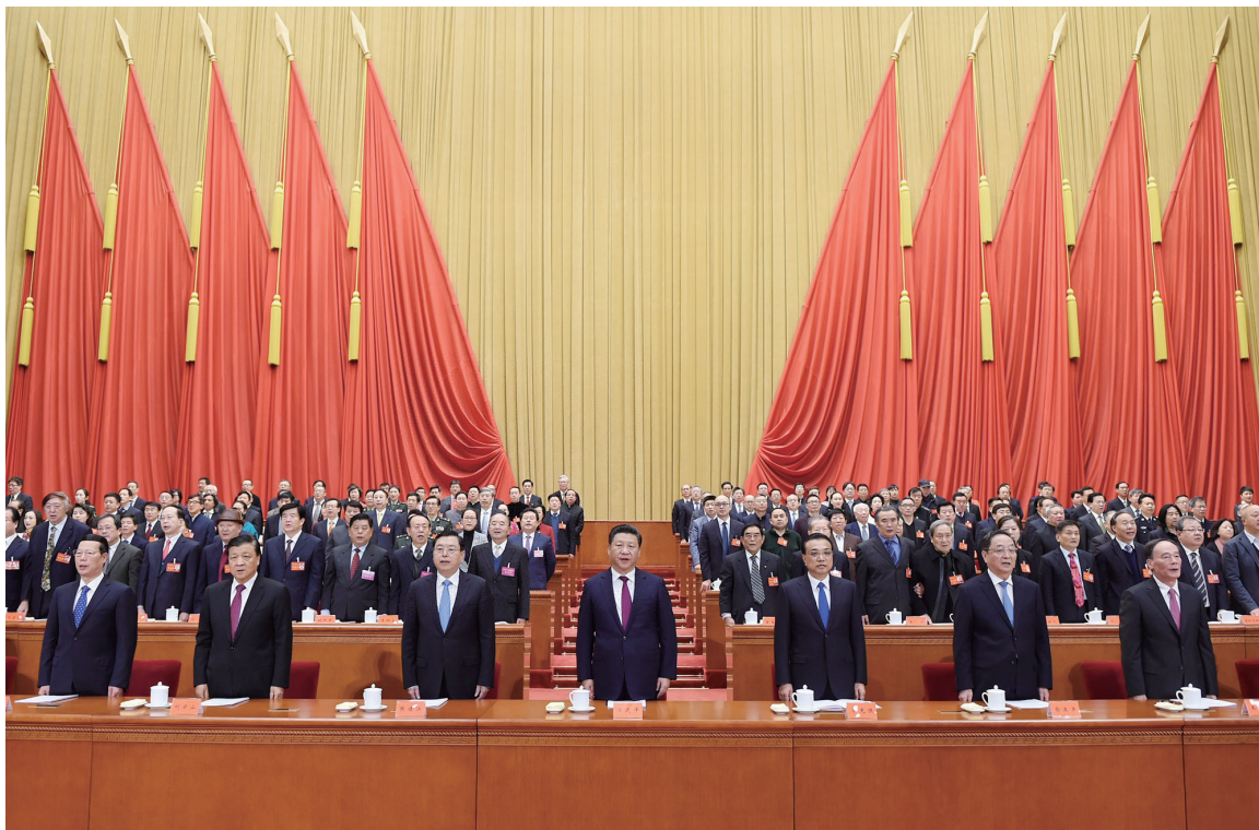
11月30日,中国文学艺术界联合会第十次全国代表大会、中国作家协会第九次全国代表大会在北京人民大会堂开幕。党和国家领导人习近平、李克强、张德江、俞正声、刘云山、王岐山、张高丽等出席大会。

党,中华文化独一无二的理念、智慧、气度、神韵,增添了中国人民和中华民族内心深处的自信和自豪。实现中华民族伟大复兴,是一场震古烁今的伟大事业,需要坚忍不拔的伟大精神,也需要振奋人心的伟大作品。