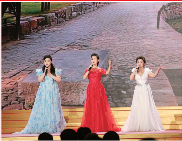
第十次文代会、第九次作代会代表联欢晚会剪影