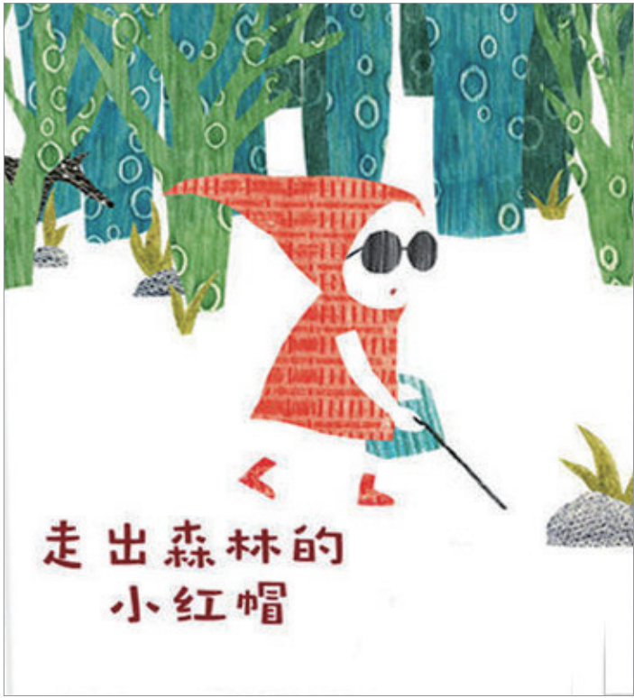
《走出森林的小红帽》封面