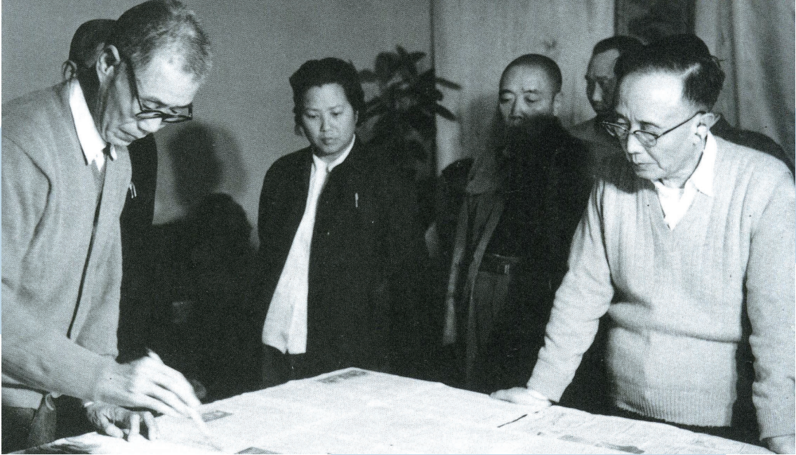
1962年潘天寿与郭沫若相聚于杭州,切磋画艺。

潘天寿的用笔,取南宋水墨苍劲和浙派的健拔,而去其率直颓放、单薄燥硬;得书法用笔的“留”、“缩”、凝重,而无人人画末流的庸弱琐碎,故大刀阔斧,形态方折,而机趣圆融,寓圆于方,厚重清警,“沉着畅快”。如果说董其昌的笔墨,堪称“笔精墨妙”,为“温柔敦厚”偏于秀美的典型,那么,潘天寿的笔