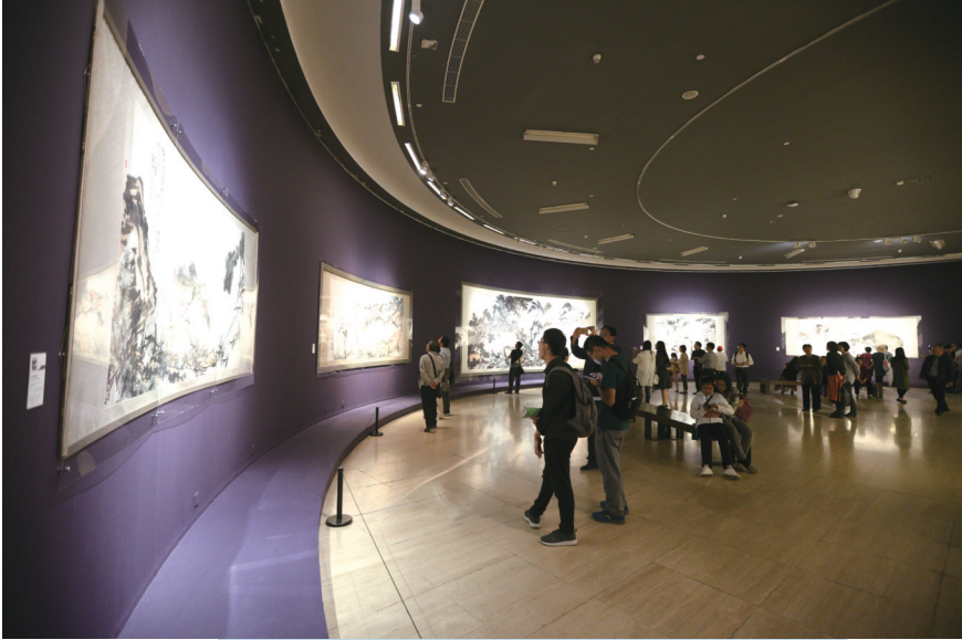
“民族翰骨——潘天寿诞辰120周年纪念大展”现场

画要写“形”,点画的关系结合以成形。写形要有一种结体的方式,所以笔墨的含义包含笔、墨以及结体方式。所谓结体就是结构,比如如何画一块石头,一组石头,一棵树,一组树,等等。个体如何结成局部的小体、再到局部,最后再成为大