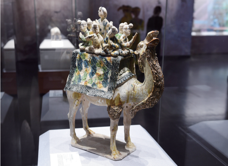
三彩骆驼载乐俑(唐)

交流、碰撞和融合出的全新火花。 据介绍,此次展览是国家大剧院推出的“中国古代音乐文物系列”又一重要展览,也是为响应一带一路战略倡议所作出的积极尝试。主办方表示,希望通过举办此次展览,更好地推动中华优秀传统文化的传承和弘扬,将艺术舞台延伸到更广阔的空间,使观众充分感悟“文明因交流而多彩,文明因互鉴而丰富”的深刻哲理,从而进一步坚定文化自信,激荡起实现中国梦的情怀和决心。 展览将持续至7月10日。