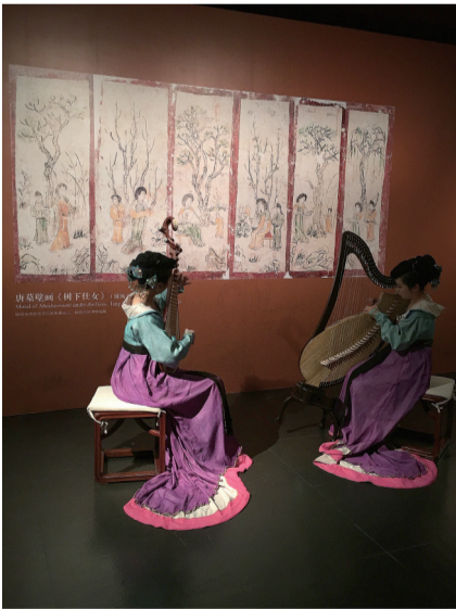
唐墓壁画《树下仕女》