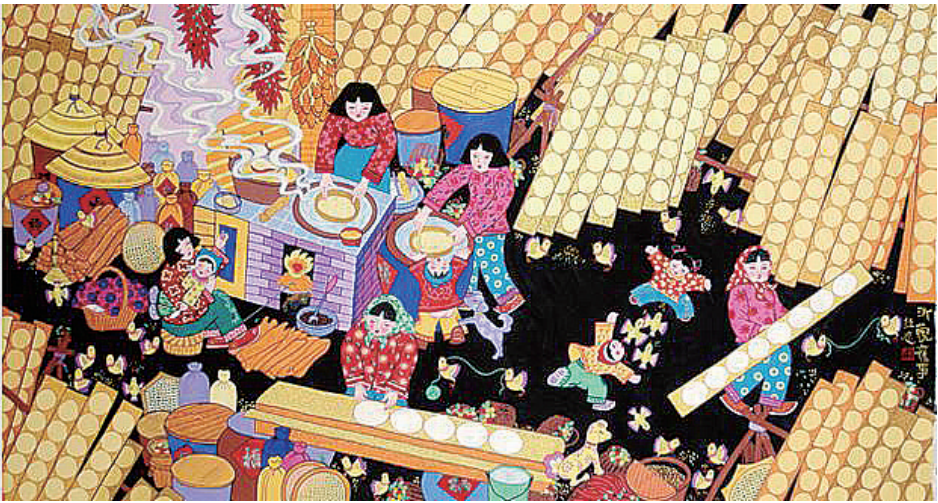
任忍作品《沂蒙旧事》

李敬泽谈到，范稳是一位对我们国家和民族的历史文化始终怀着热爱、礼敬之心去进行写作的作家。关于抗战的书写和叙事一直是中国文学中非常重要的脉络之一，但对于这样一段中华民族在苦难中奋起斗争的伟大历史而言，我们文学的书写依然是不够的。从《吾血吾土》到《重庆之眼》，范稳近年来始终自觉投入抗战史的书写中，选择大题材、有难度的写作，这体