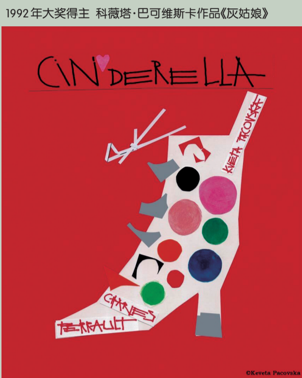
1992年大奖得主 科薇塔·巴可维斯卡作品《灰姑娘》