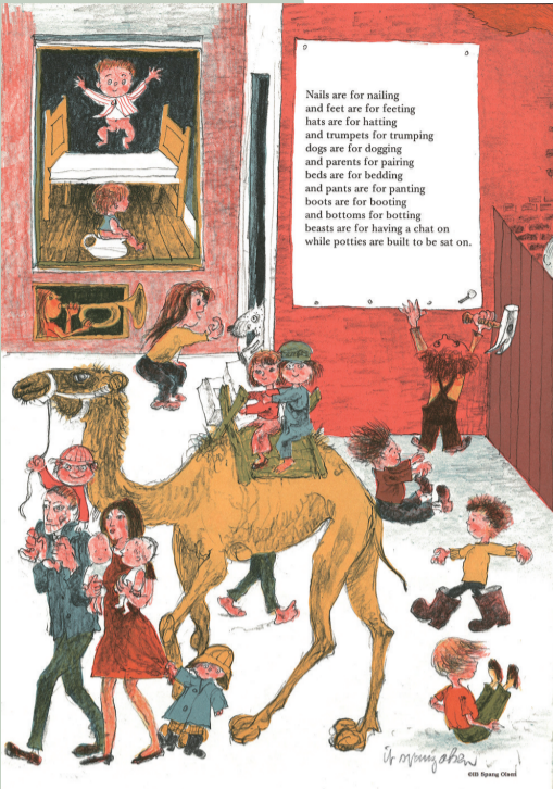
依卜·斯邦·奥尔森作品《戏法》