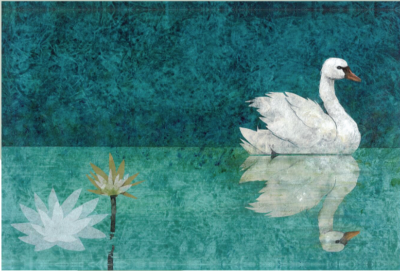
1986 年大奖得主 罗伯特·英潘作品《丑小鸭》