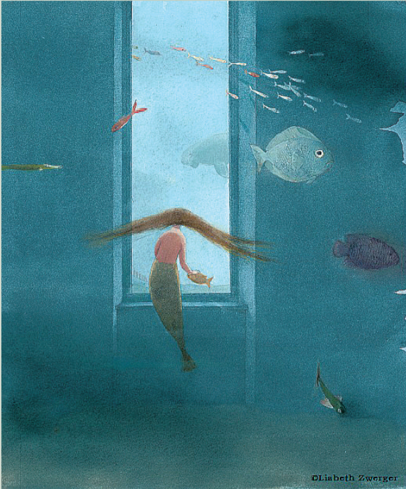
1990年大奖得主 莉丝白·茨威格作品《海的女儿》

据悉，国际安徒生奖诞生于1956年，由丹麦女王玛格丽特二世赞助、国际儿童读物联盟创立。这一大奖与德籍犹太裔女记者、作家吉拉·莱普曼密不可分。她于二战后重返德国，协助实施妇女与儿童再教育计划。她认为阅读是促进国际谅解与和平的重要手段，而在战争中受害最大的是儿童。从搜集世界各国出版的最佳童书、举办展览开始，她最终创设了国际儿童读物联盟。国际安徒生奖每两年评比一次，根据候选人对童书的贡献作整体考量。2016年，曹文轩成为首位获奖的中国作家。1966年，随着绘本在全球范围的蓬勃发展，国际安徒生奖增设了插画奖。回顾其50余年的历程，当属前捷克斯洛伐克和德国最出人才，各有四届桂冠得主。由于终身成就奖的性质，画家们捧得荣誉大多在五六十岁，不过也有例外，1974年该奖项得主、伊朗插画家法尔希德·马斯哈里当时年仅31岁，在历届获奖者中最为年轻。