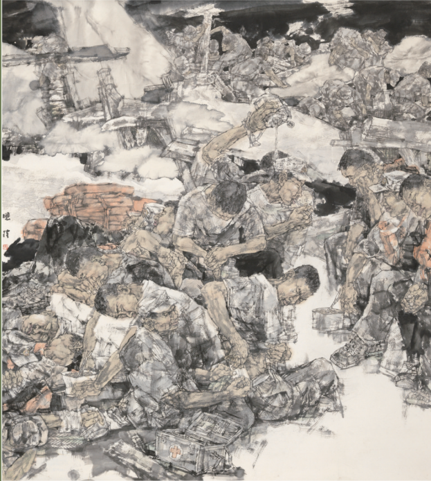
《酣声鼾声》(国画) 曹晓凌 作