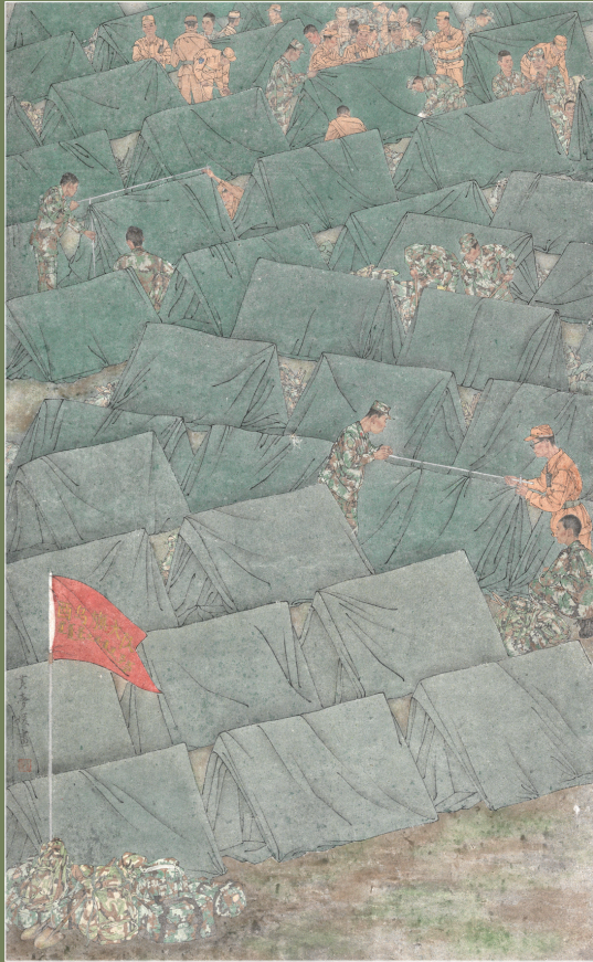
《壕沟的守卫者》(国画) 黄梦媛 作