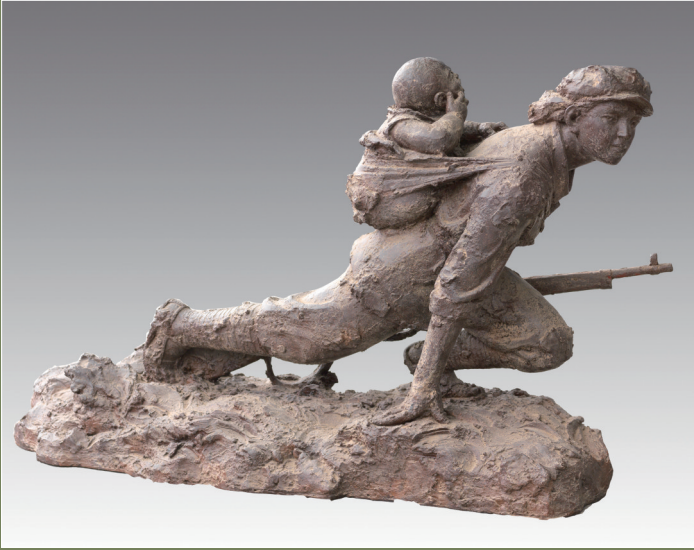
《长征1936》(雕塑) 郭雪 作