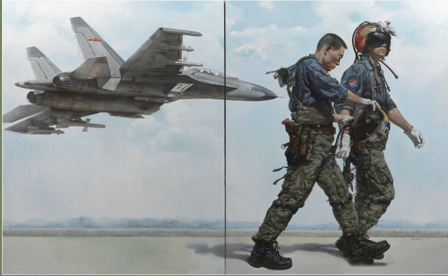
《突破第一岛链》(油画) 周末 作