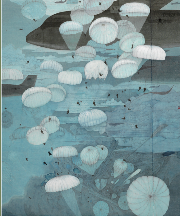
《中国行动》(国画) 张蕊 作