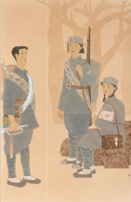
《光辉岁月·从军的路上》(国画) 安秋菊 作