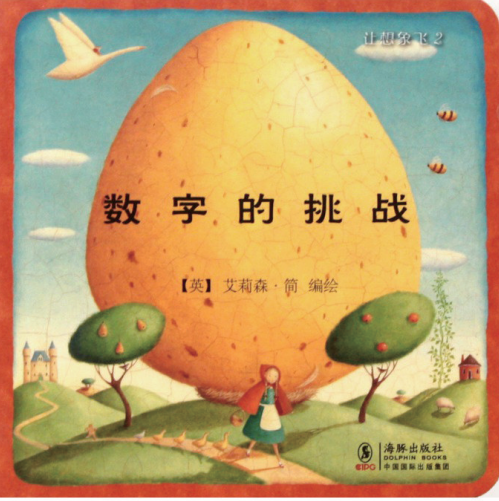
《数字的挑战》艾莉森·简 编绘