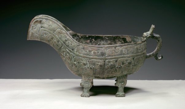
夔龙纹青铜匜(春秋)