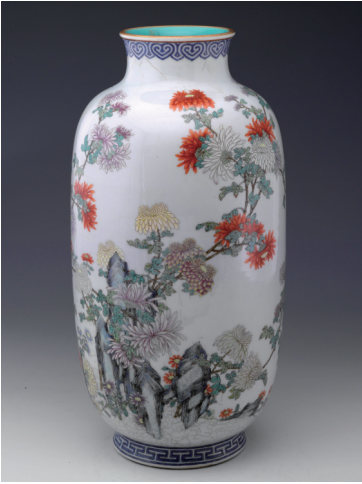
粉彩菊花纹瓷灯笼尊(清)