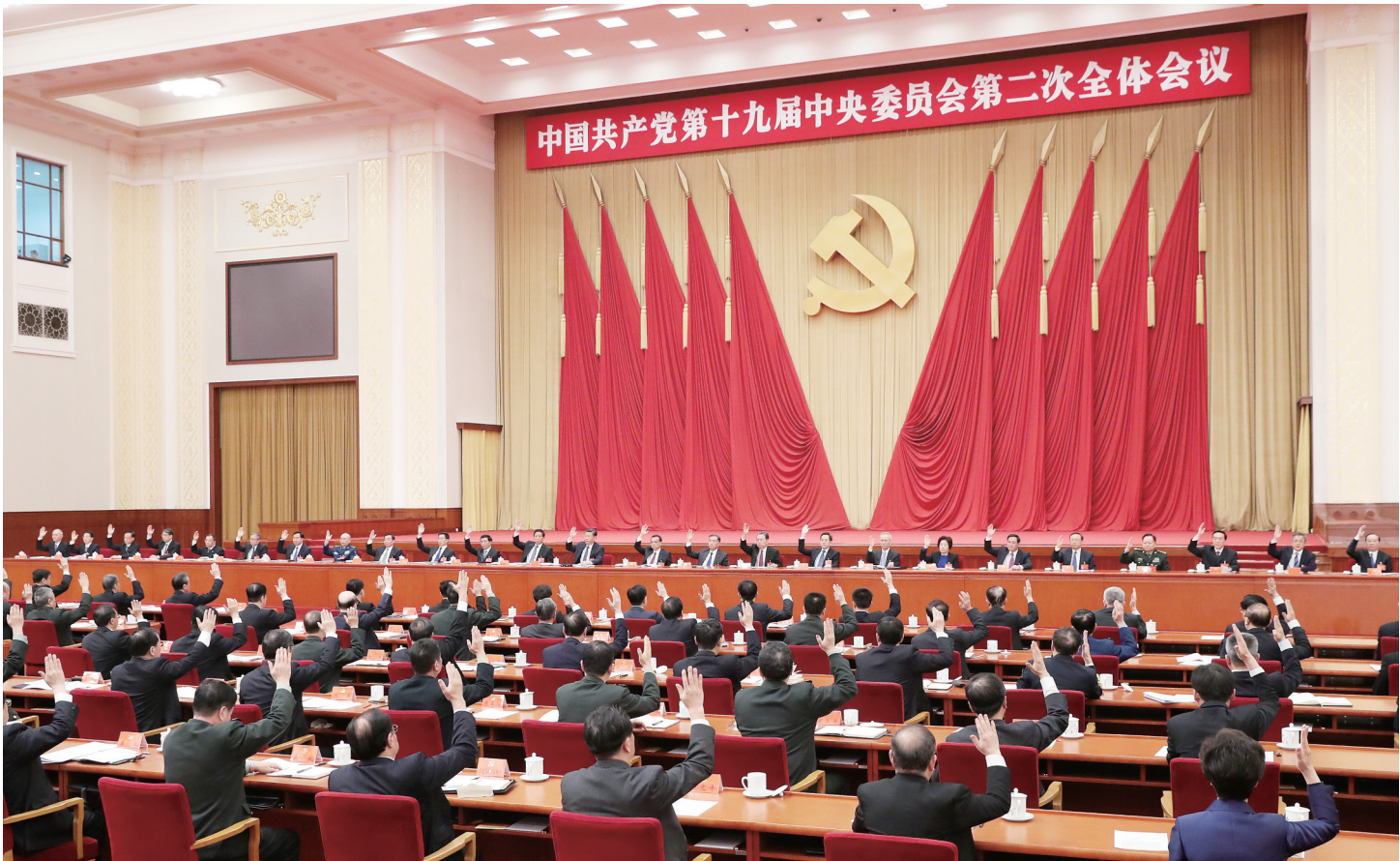
中国共产党第十九届中央委员会第二次全体会议,于2018年1月18日至19日在北京举行。中央政治局主持会议。