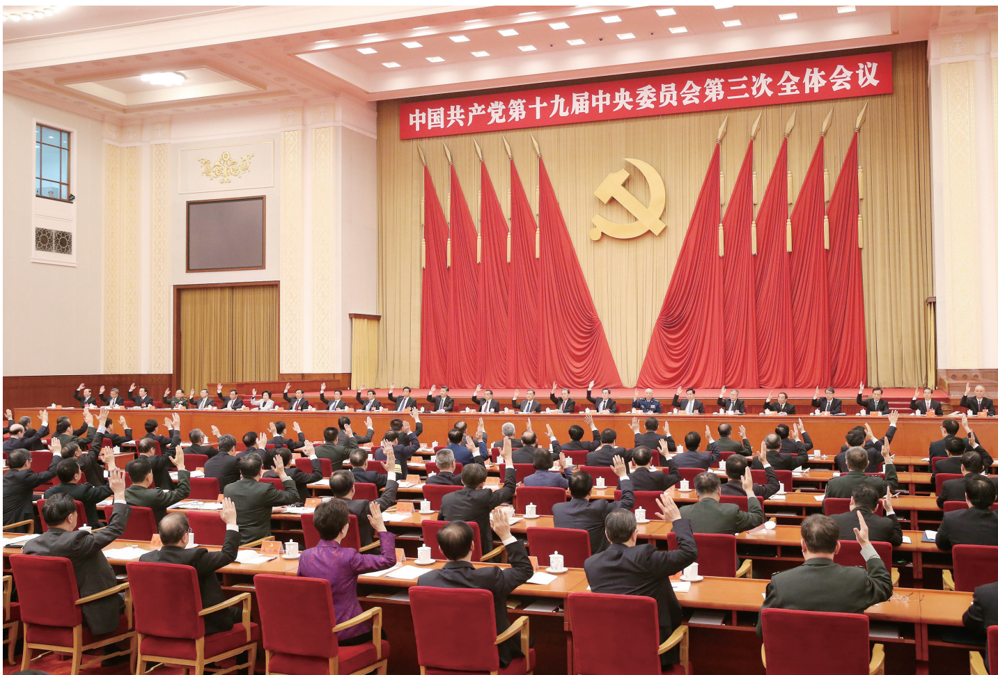
中国共产党第十九届中央委员会第三次全体会议,于2018年2月26日至28日在北京举行。中央政治局主持会议。