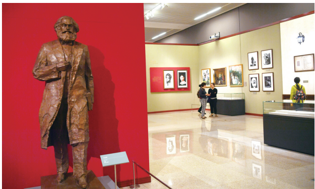
五月五日《真理的力量——纪念马克思诞辰二百周年主题展览》在国家博物馆开幕。图为观众参观展览。

展览主办单位、承办单位及中央党校(国家行政学院)、教育部、中央军委政治工作部、中央宣传文化单位、北京市委宣传部负责同志,首都各界群众代表以及国外出借展品机构代表等约600人参加开幕式。据悉,展览将持续到8月5日。