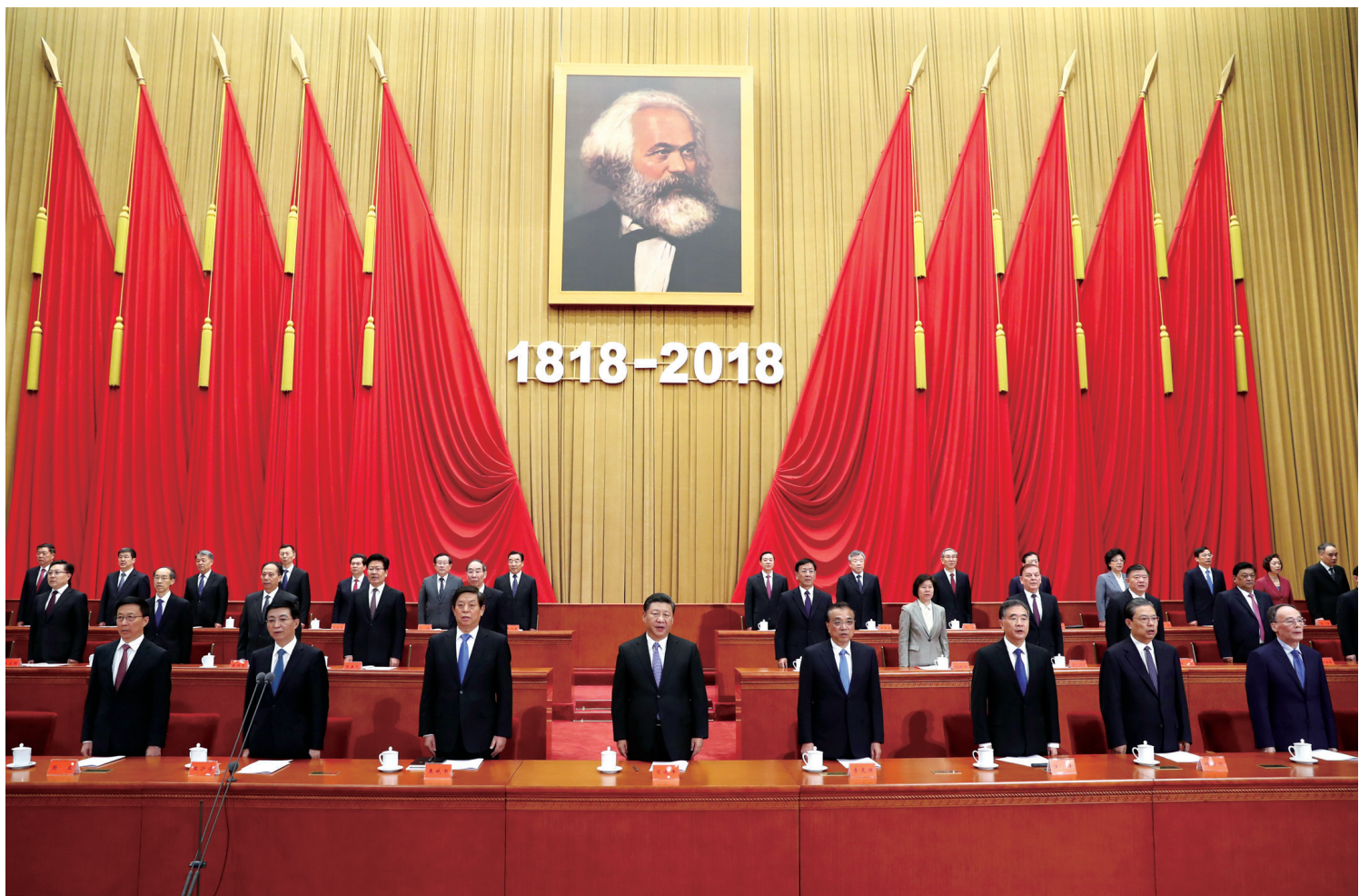
5月4日，纪念马克思诞辰200周年大会在北京人民大会堂隆重举行。习近平、李克强、栗战书、汪洋、王沪宁、赵乐际、韩正、王岐山等出席大会。