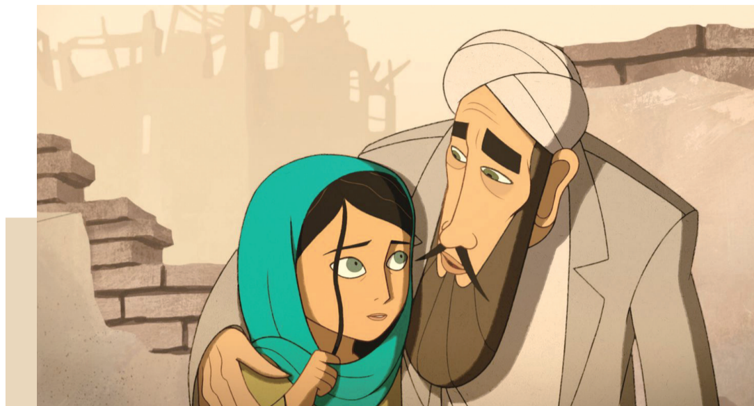
帕尔瓦娜与她的父亲

片中的现实和传说故事部分穿插并行，像两条互不相干的河流，在影片铺陈发展的过程中齐头并进，最后汇聚在高潮时刻，一同迸发。如果我们把“不可见的未知”