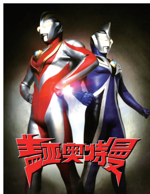
盖亚奥特曼(左)与阿古茹奥特曼(右)

面对阿古茹，盖亚的内心充满迷茫——不能消灭他，也无法拯救他，更不能遵循他的理念。然而人类再怎么不堪，也有其独到的可爱与可贵。即便是阿古茹本人，也在一次次事件中被人类的热情所打动——比如他被一同对抗外星怪兽的地球防卫队当作伙伴，而非单纯当作抗击敌人的武器；等等。正是因为这一点，阿古茹才逐渐消除了内心的迷茫和误解。阿古茹的变化同时也