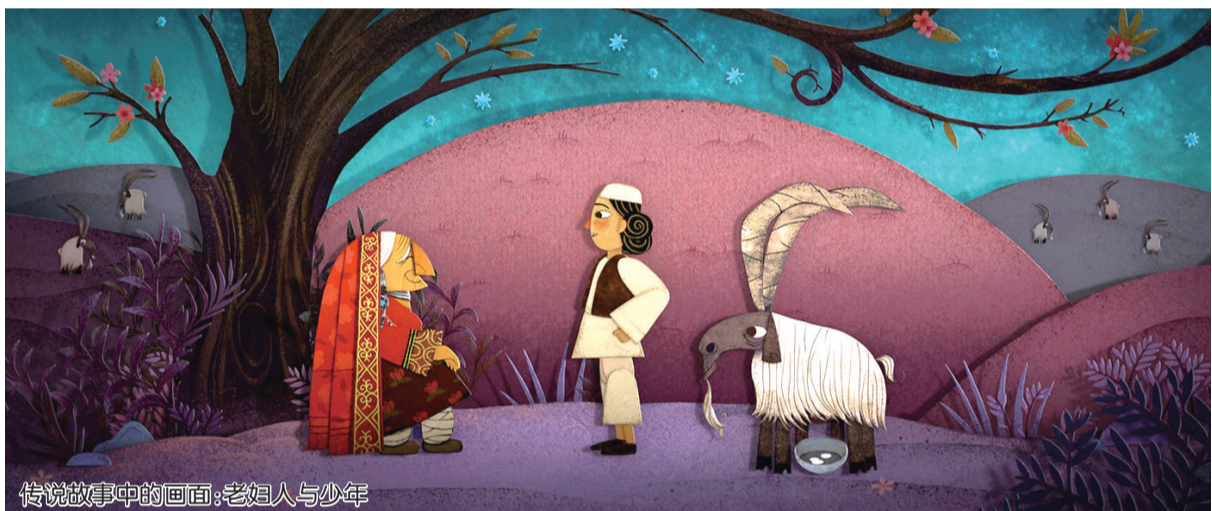
传说故事中的画面：老妇人与少年

所幸影片在最后还是给了我们一丝希望：帕尔瓦娜完成了那个在现实中几乎不可能完成的任务——她将自己的父亲带回了家。然而日常生活依旧辛酸，与之相伴的只有前述那种无力感。即使如此——即使无力，即使生命终将消亡，即使文明不可避免地要被毁于一旦，也无法阻止人类在这些过程中的不懈奋斗。而这，就是我们存在的意义，就是我们用以对抗绝望的悲壮与永恒。