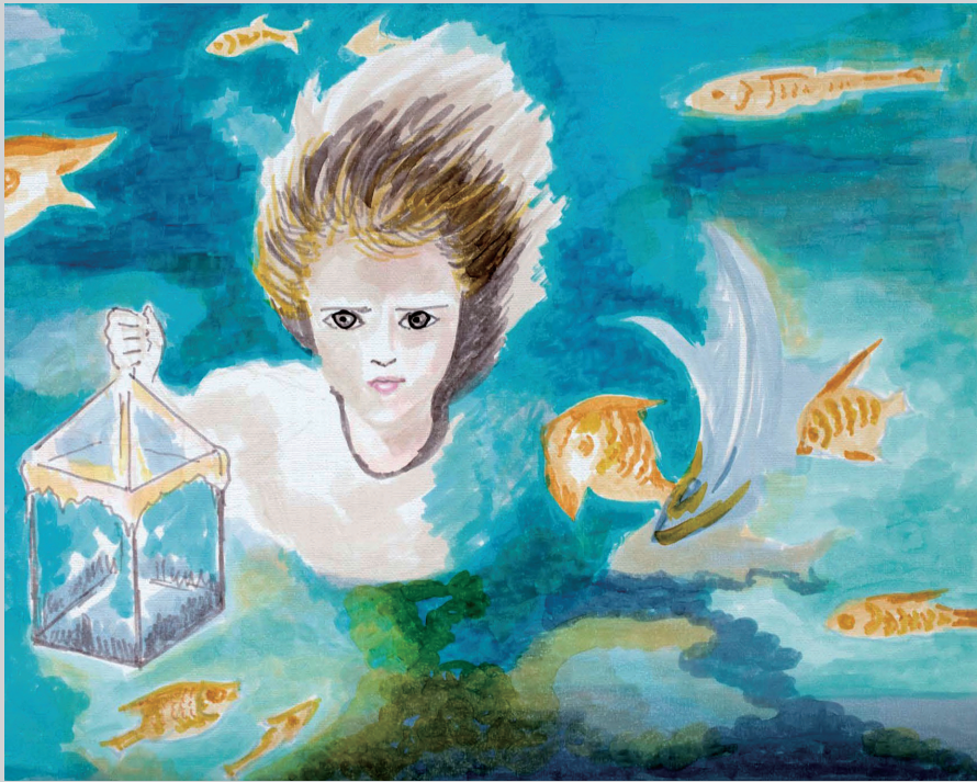
《海百合》插图，徐小斌 文/图