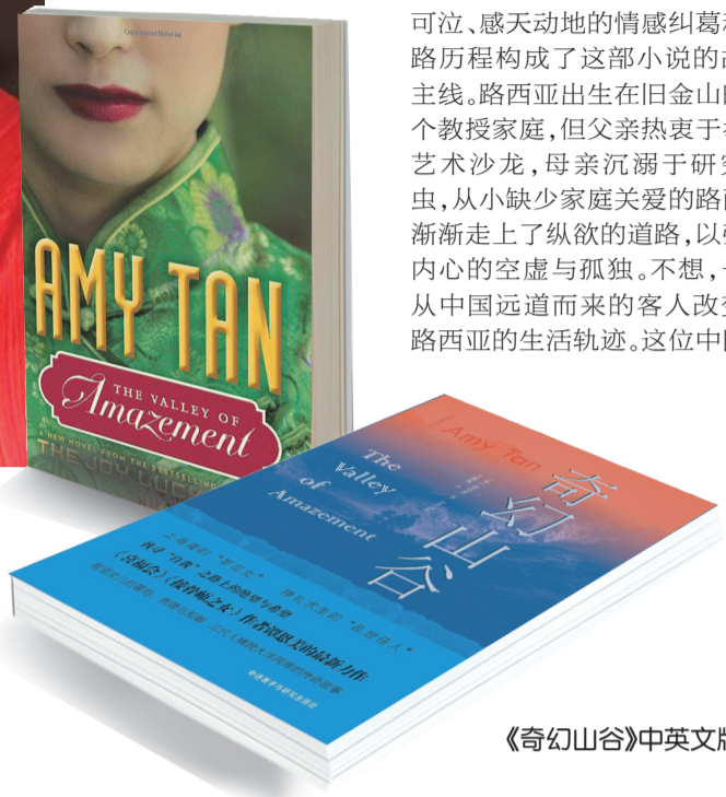
《奇幻山谷》中英文版

2005年,美国华裔作家谭恩美凭借她在小说《拯救溺水之鱼》中所再现的不同于以往的主题和题材,实现了个人在文学创作上的超越和转型。