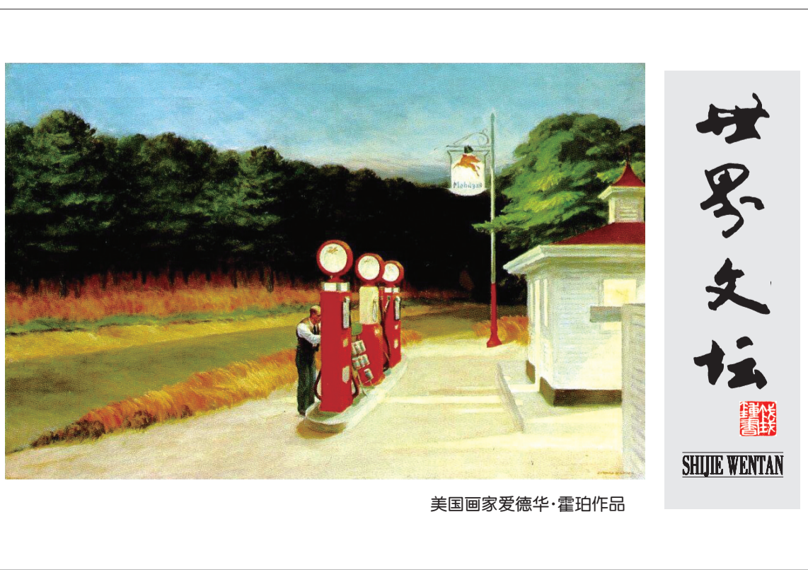
美国画家爱德华·霍珀作品

据介绍,近些年来,中国诗歌学会、北京大学中国诗歌研究院非常关注国际诗歌交流活动。中美诗歌节、中日、中法诗人文化交流,中俄诗歌节等活动蓬勃开展。