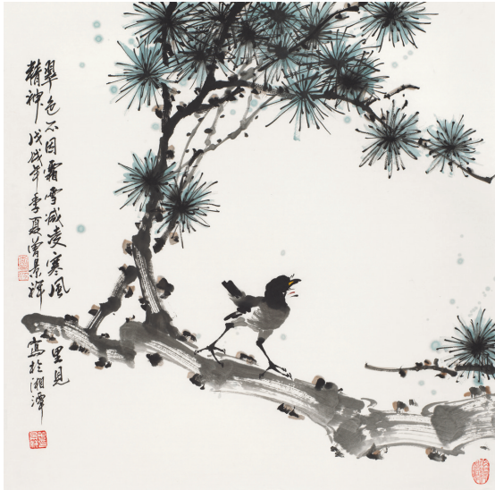
凌寒风里见精神(国画)