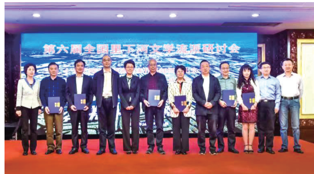
与会领导为里下河文学研究中心特约研究员颁发聘书

对于如何开拓里下河文学“走出去”的广阔空间，与会专家学者提供了不同的经验和视角，提出了意见和建议。作家与评论家双向互动，加强研究、研讨和推介，大力扶持作品发表、出版，开展文