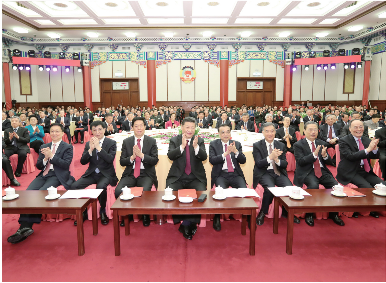
2018年12月29日，全国政协在北京举行新年茶话会。党和国家领导人习近平、李克强、栗战书、汪洋、王沪宁、赵乐际、韩正、王岐山出席茶话会并观看演出。

新华社北京2018年12月29日电 中国人民政治协商会议全国委员会12月29日上午在全国政协礼堂举行新年茶话会。党和国家领导人习近平、李克强、栗战书、汪洋、王沪宁、赵乐际、韩正、王岐山等同各民主党派中央、全国工商联负责人和无党派人士代表、中央和国家机关有关方面负责人以及首都各族各界人士代表欢聚一堂，喜迎2019年元旦。 中共中央总书记、国家主席、中央军委主席习近平在茶话会上发表重要讲话。他强调，2019年是新中国成立70周年，是决胜全面建成小康社会关键之年。我们要崇尚学习、加强学习，崇尚创新、勇于创新，崇尚团结、增进团结，既抢抓发展机遇，又妥善应对挑战，鼓舞全党全国各族人民勇往直前、再创辉煌。