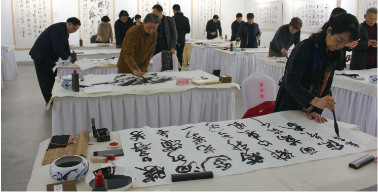
艺术家们在发布会现场挥毫泼墨

1月11日,由山东济南市委宣传部指导,中央数字电视书画频道、济南广播电视台、济南市历城区委区政府、济南城建集团主办的第二届中国鹊华论坛新闻发布会在京举行。主办方有关领导及数十位书画艺术家与会。