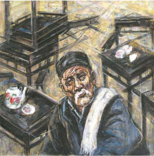
王利发 张丽颀 作

老舍是中国现代文学史上的著名作家,直到今天,他的作品仍然以跨越时空的生命力感染着当下的读者。2019年适逢老舍诞辰120周年,1月13日,由北京市文物局、北京市文联、北京演艺集团主办,老舍纪念馆、中国老舍研究会、北京市老舍研究会、北京市曲剧团承办的“纪念老舍先生诞辰120周年——老舍笔下的人物及街市”画展在首都博物馆开幕。此次展览共展出76幅国画、油画、素描等作品,观众可直观感受到老舍文化的独特韵味与北京传统民俗风情。