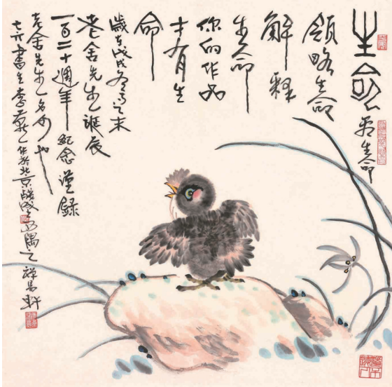
老舍爱猫 徐德亮 作