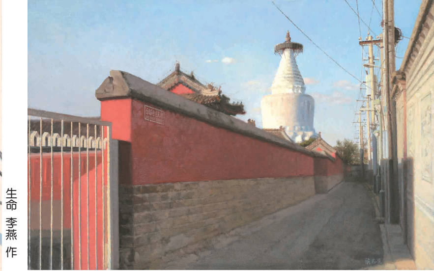
白塔斜阳 侯志民 作