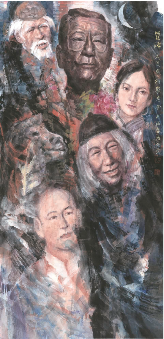
丰碑 何雨春 作