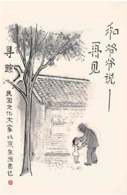
和爷爷说再见 李滨声 作