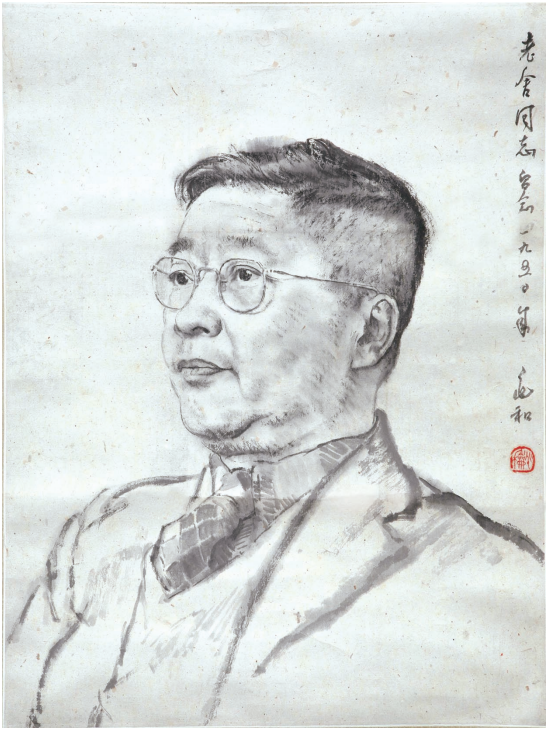
老舍先生画像 蒋兆和 作