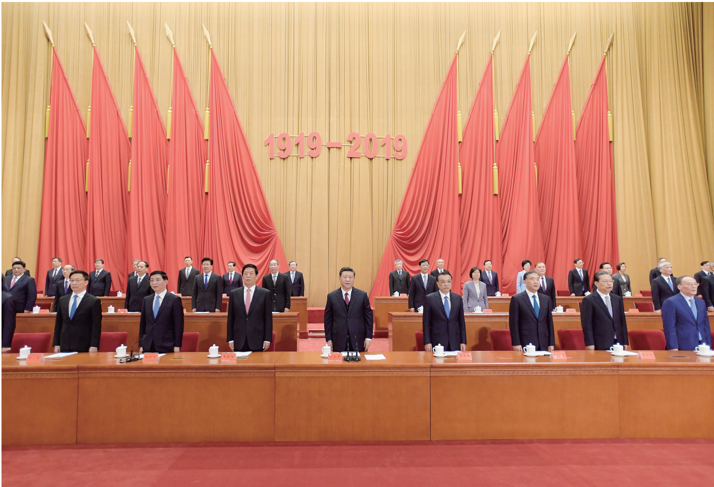
4月30日,纪念五四运动100周年大会在北京人民大会堂隆重举行。习近平、李克强、栗战书、汪洋、王沪宁、赵乐际、韩正、王岐山等出席大会。