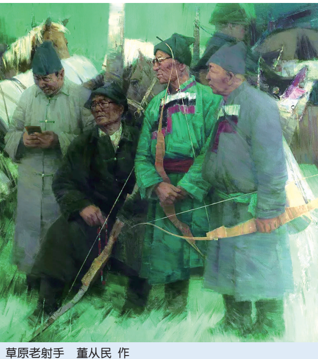
草原老射手 董从民作

很久没有如此迫切地去观展了。6月21日,120位中国知名画家参展的“草原四季 亮丽北疆——全国美术作品展览”在中国美术馆开幕。我迫切地想知道,历时一年,被严寒酷暑拥抱和“锤炼”的艺术家们,会把美丽的内蒙古画成什么样?老中青三代画家将眼中的草原、心中的草原、笔下的草原融汇成规模盛大的画展时,会让我与观众们感悟到什么?