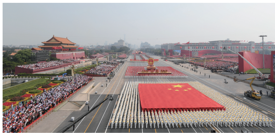
10月1日上午,庆祝中华人民共和国成立70周年大会在北京天安门广场隆重举行。