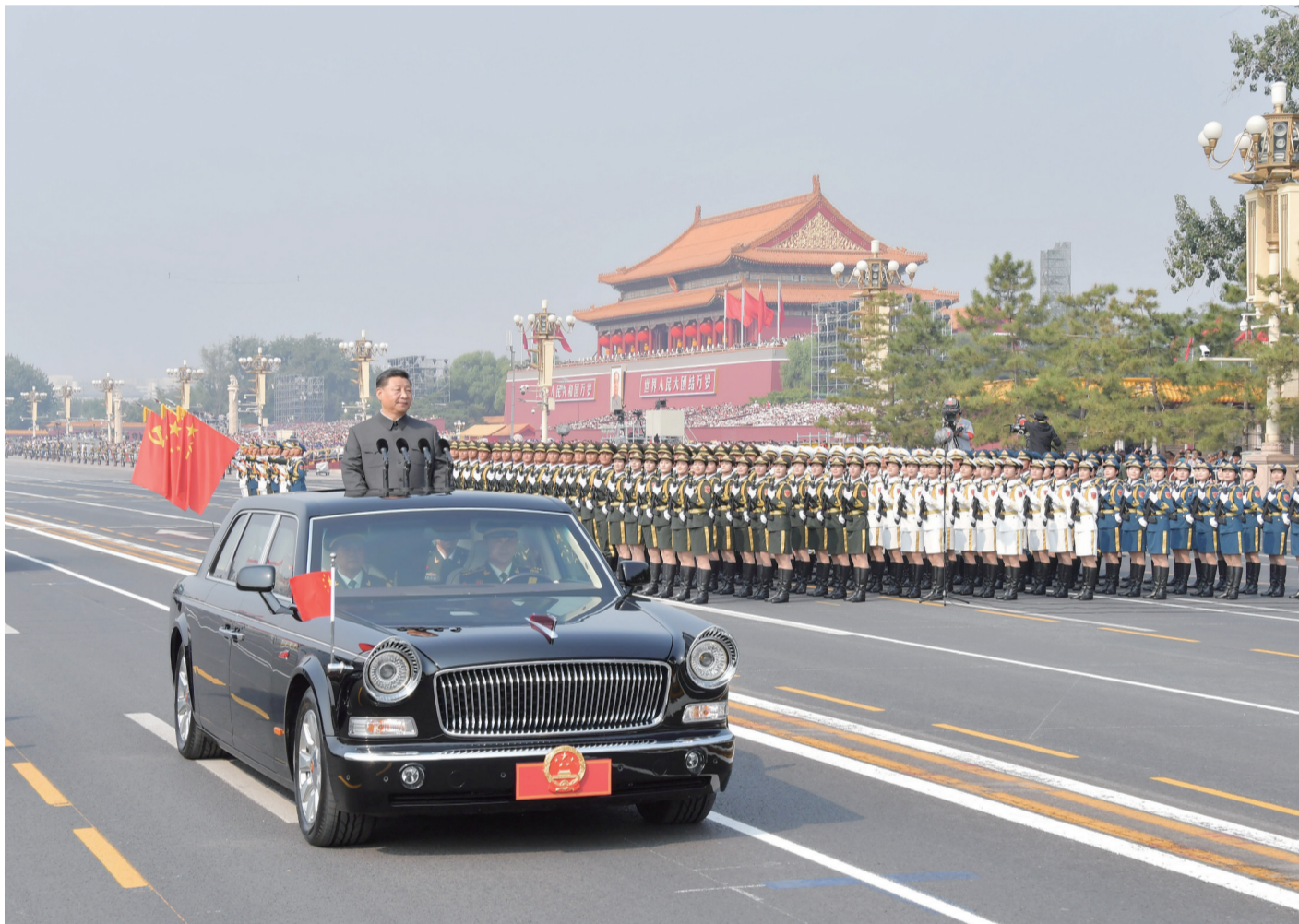
10月1日,庆祝中华人民共和国成立70周年大会在北京天安门广场隆重举行。这是中共中央总书记、国家主席、中央军委主席习近平检阅受阅部队。

新华社北京10月1日电 壮阔七十载,奋进新时代。10月1日上午,庆祝中华人民共和国成立70周年大会在北京天安门广场隆重举行,20余万军民以盛大的阅兵仪式和群众游行欢庆共和国70华诞。中共中央总书记、国家主席、中央军委主席习近平发表重要讲话并检阅受阅部队。