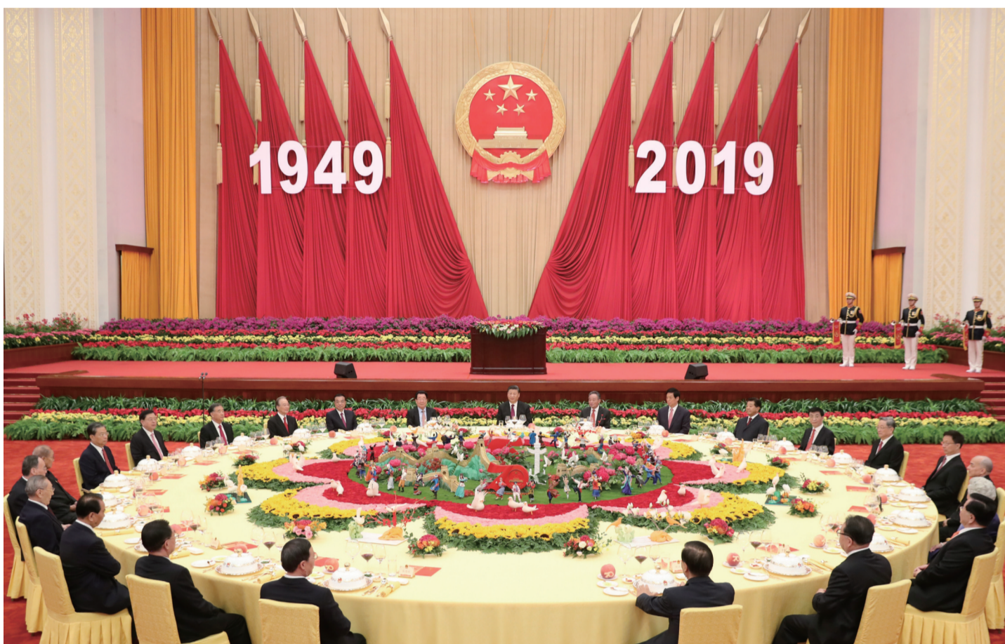
9月30日晚,庆祝中华人民共和国成立70周年招待会在北京人民大会堂隆重举行。中共中央总书记、国家主席、中央军委主席习近平出席招待会并发表重要讲话。