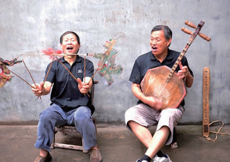
传统的老腔是与皮影戏结合的