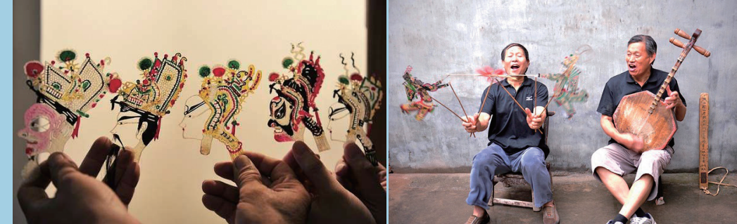
传统的老腔是与皮影戏结合的