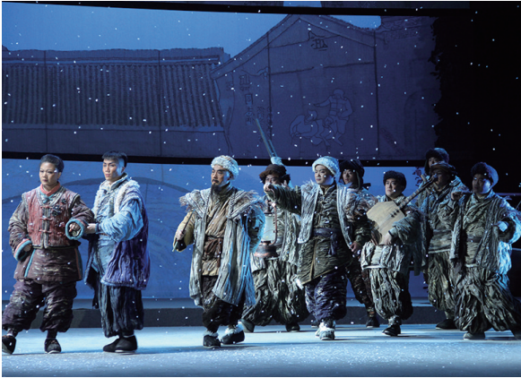
陕西演艺集团现代京剧《风雨老腔》