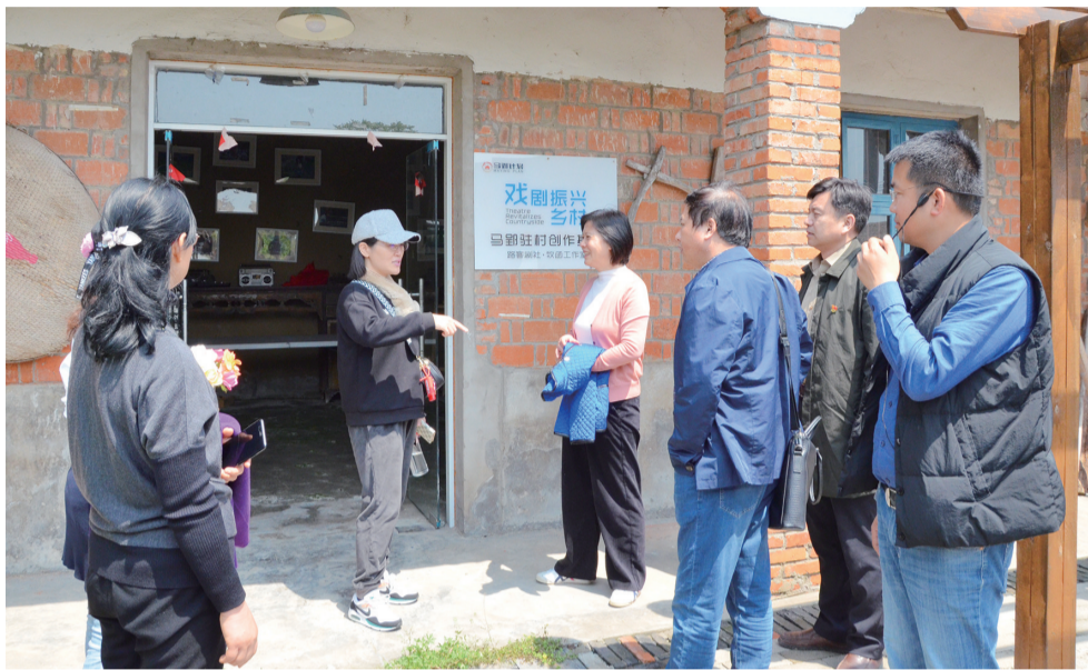
安徽作家在马群社区采访

本报讯 近年来,安徽省文联始终把助力脱贫攻坚作为一项重要的责任,强部署细调研,拓宽思路,积极引导广大作家艺术家坚持以人民为中心的创作导向,深入生活,扎根人民,主动进入脱贫攻坚的主战场。安徽省作协结合安徽省文学工作的实际,多措并举,扎实助力脱贫攻坚工作,用文学的形式展示决战决胜脱贫攻坚、全面建成小康社会的伟大实践,及时反映建设现代化五大发展美好安徽的成就,讲好江淮儿女奋斗圆梦的感人故事,进一步推动安徽文学高质量发展。