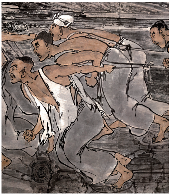
壶口旱地行船图(局部一)