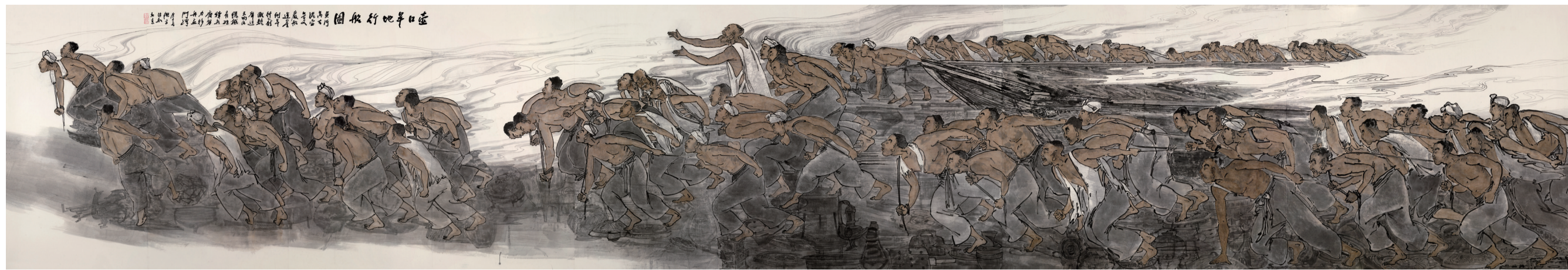
壶口旱地行船图 顾平作