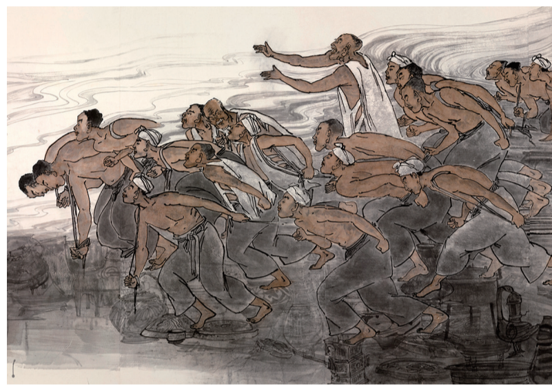
壶口旱地行船图(局部二)

题款作五言古风《壶口旱地行船图》：黄河万古流，壶口百丈崖。船运上崖侧，早行下龙湾。号声连天响，巨缆铁肩担。纤夫齐努力，移舟孟门湾。