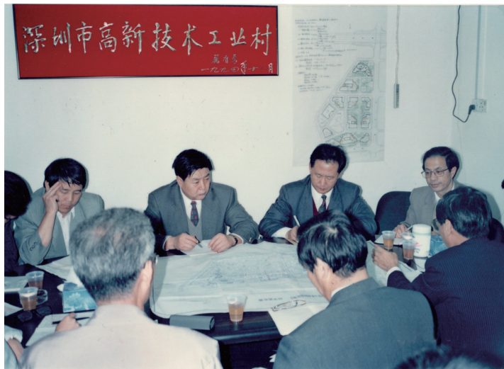
一九九四年十二月二十七日李子彬在深圳高新科技园村现场办公

短短40年,深圳创造了世界城市发展史上的奇迹。这是在党中央坚强领导下,深圳历届领导与全市人民接力式奔跑共同书写的传奇。但是不能不承认,在接力式奔跑的过程中,总有些关键的节点,总有些速度超群的人,总有些人发挥着异乎寻常的作用。李子彬,就是这样的人。他,让深圳传奇更加熠熠生辉。