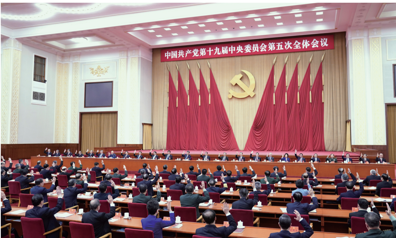
中国共产党第十九届中央委员会第五次全体会议,于2020年10月26日至29日在北京举行。中央政治局主持会议。