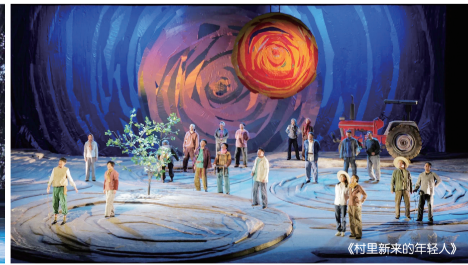
《村里新来的年轻人》