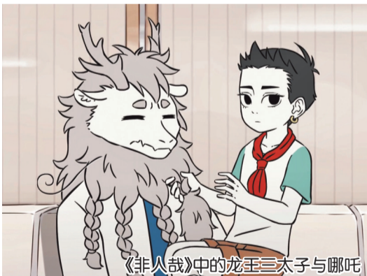
《非人哉》中的龙王三太子与哪吒

在当下无数画面精良、特效炫目的大制作动画片中，有一类动画片独出心裁，以简单的人物造型、朴素的动画画面、简短的动画时长异军突起，它们被称为“泡面番”动画。