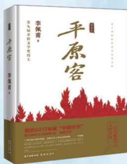
李佩甫 《平原客》 2017年中国好书 每一个人物都是 “活的时代精神的灵魂”