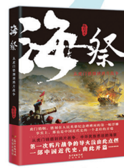
陈启文 《海祭——从虎门销烟到鸦片战争》 从虎门销烟到鸦片战争, 是中华民族悲壮的海祭