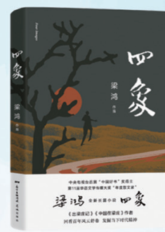
梁鸿 《四象》 梁鸿最具实验性和现代性的长篇小说