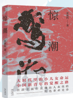
张新科 《惊潮》 首部全面彰显潮汕人血性的 红色革命史诗