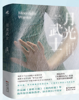
虹影 《月光武士》 睽违多年,虹影全新女性主义小说