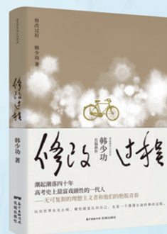
韩少功 《修改过程》 无可复制的理想主义者 和他们的绝版青春