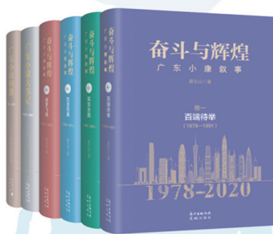
章石山 《奋斗与辉煌——广东小康叙事》 国内第一部全景式史志式 记录小康工程的鸿篇巨作