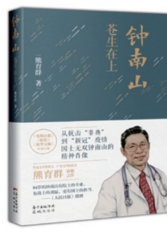
熊育群 《钟南山:苍生在上》 国士无双钟南山的精神肖像