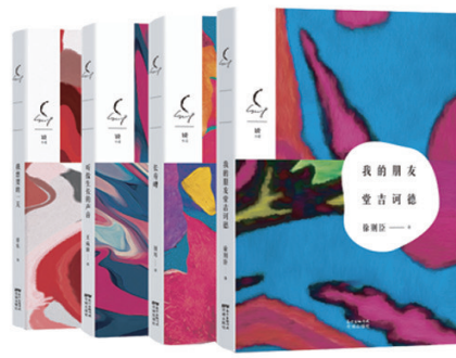
“锐小说”(共17册) “中华优秀出版物”获奖作品 中国新锐作家作品大展,呈现和保有 当代文学的先锋性