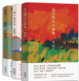
李娟 《遥远的向日葵地》 《记一忘三二》 《我的阿勒泰》 “中国好书”“鲁迅文学奖”“中华优秀出版物” 获奖作品