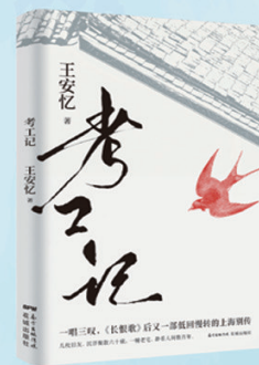
王安忆 《考工记》 《长恨歌》后又一部 低回慢转的上海别传