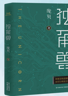
庞贝 《独角兽》 人工智能时代的技术伦理与道德重建