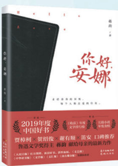
蒋韵 《你好,安娜》 2019年中国好书 走进青春的深处, 每个人都是爱的信徒