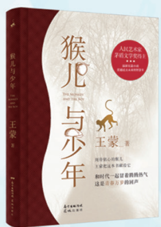
王蒙 《猴儿与少年》 王蒙最新长篇小说 这是青春万岁的回声