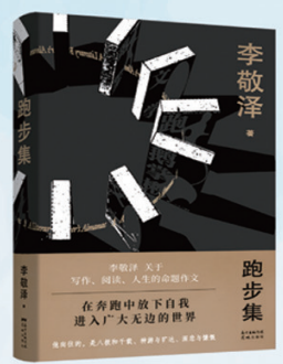
李敬泽 《跑步集》 关于写作、阅读、人生的命题作文