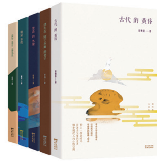
“现代性五面孔”(共15册) 一幅崭新的当代中国人的精神拼图