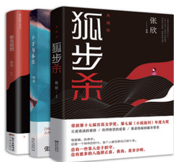
张欣“花城三部曲” 《黎曼猜想》 《千万与春住》 《狐步杀》 最早找到文学上的城市感的小说, 都市文学的独流