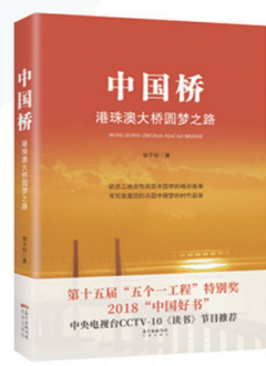
曾平标 “粤港澳大湾区”系列 《中国桥——港珠澳大桥圆梦之路》 第十五届“五个一工程”奖特别奖 2018年中国好书