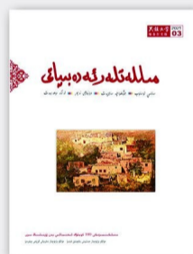
每期定价 20.00元 全年定价 120.00元(维)