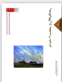
每期定价 20.00元 全年定价 120.00元(蒙)