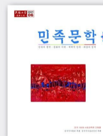
每期定价 20.00元 全年定价 120.00元(朝)

《民族文学》汉文版1981年创刊,2009年以来又创办蒙古、藏、维吾尔、哈萨克、朝鲜五种文字版。系全国性少数民族文学期刊,中国作家协会主管、中国作家出版集团主办。