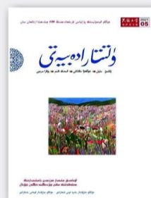
每期定价 20.00元 全年定价 120.00元(哈)