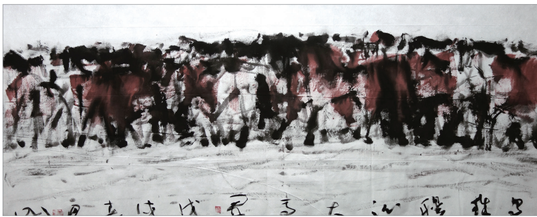
乌珠穆沁大马群(2018) 杨刚作

《自由长旅》一路看下来,在不断赞叹的同时也在想:是什么造就了杨刚作品中一以贯之的积极极意?我想应是草原的广袤天地与牧民的博大胸怀。2019年他在时隔近40年后,又创作了油画《迎亲图》。绘画的介质变了,从纸本到油画。笔法也变了,从工笔到写意。但主题却未变,仍是女儿远嫁,在马上伏身与妈妈拥吻告别。我猜想,杨刚在他生命快要终结时再次创作此画,一定是想起了曾经给予他温暖与快乐的牧民们。