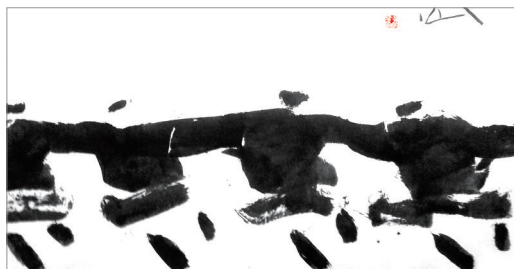
高原的日子(2012) 杨刚作

这把提琴是老琴手生命寄托。虽然步入老年,但只要提琴,他的生命便会充满活力。从这两幅画的创作时间看,杨刚也经历了从中年向老年的转变,对生命的体验或许也有了不同感悟。《小提琴声》画的是他自己吗?杨刚在《绘事随缘》一文中说:“从北京画院退休,我开始在家里画。‘入境’是我的斋号,意思就是像陶渊明讲的‘入境皆为庐,心远地自偏’,‘上有天堂福,下有人境庐’。我一入境,就感觉到了天堂,一拿起画