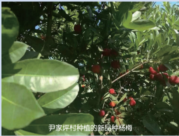
尹家坪村种植的新品种杨梅