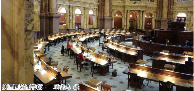
美国国会图书馆

几十个国家美不胜收的图书馆和各有其美的中外书店，洋洋大观难以尽述，宛如夜空星光般闪烁，如雨后彩虹般璀璨。作为一个读者，我仅是简略浏览就已身心陶醉，禁不住向读者们推荐，希望有朝一日能够以这本书作为指南，真正在世界图书馆与书店之中漫游。