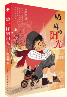
《奶一样的阳光》常新港 著 人民文学出版社 天天出版社 2022年4月出版

本书是常新港成长题材的全新儿童文学力作,聚焦当代老龄化、城市化背景下,发生在儿童及其周围人群间关于亲情伦理、成长抉择、对生命的认知等诸多问题。小说用写实的笔触展现当代家庭的复杂境遇,用生动的笔墨描摹北国鲜活的生活旧闻和充满生机的童年,巧妙借用过去和现在、城市和乡村、成人和孩子的多重视角,带领小读者穿越时空,进入广阔丰富的成长空间,获取有益的人生体验。