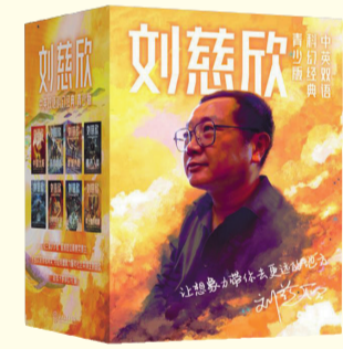
《刘慈欣中英文双语科幻小说集(青少年版)(全8册)》刘慈欣 著 刘宇昆等译 浙江教育出版社 2022年5月出版

从艺术表现来看,《陈子典儿歌300首》是一本有针对性、充满想象力的儿童读物。收入其中的329首儿歌主题符合当下儿童的思想实际,贴近低幼儿童的现实生活,内容单纯集中,一听就懂,构思新颖独特,语言生动形象,童趣浓郁,富有音乐性和动作感,文字讲究,押韵和谐,十分口语化,许多都是孩子们喜欢的快乐小诗。同时,该书采用现代与传统相结合的手法,每页儿歌绘制了精美配图,读来又顺口,又有画面感,易于记住,且充满着感情和精神层面的正能量,能够在潜移默化中充实孩子的精神世界,为孩童阅读增添许多乐趣。 一代人有一代人的生活,一代人也应该有一代人的儿歌。随着社会的进步,小燕子再也难以“飞入寻常百姓家”,马路上再也捡不到“一分钱”……传统儿歌中特有的文化元素显然已不符合今天孩子的认知,所以他们不喜欢,从而呼唤具有新时代特点的儿歌。陈子典先生在创作儿歌时,首先从幼儿的兴趣入手,选择具有时代感和趣味的题材,因而他儿歌中所讲述的内容、情感往往能体现岭南的民俗风情,城市新貌,贴近幼儿的生活经验。比如,“海心桥空中挂,/游客争相来打卡!”(《海心桥空中挂》)写的是珠江上架的人行桥;“爷爷乐开花,/带我喝早茶。/烧卖虾饺艇仔粥,/凤爪春卷萨其马。/想吃啥,就点啥。”(《他说他有钱,/退休工资逐年加。》)《爷爷带我饮早茶》写的是退休老人的幸福生活。诸如此类,无不是对现实生活和新鲜事物的生动表现。