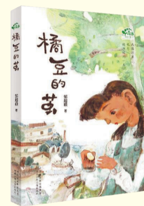
《橘豆的茧》邹超颖 著 河北少年儿童出版社 2022年4月出版

本书是常新港成长题材的全新儿童文学力作,聚焦当代老龄化、城市化背景下,发生在儿童及其周围人群间关于亲情伦理、成长抉择、对生命的认知等诸多问题。小说用写实的笔触展现当代家庭的复杂境遇,用生动的笔墨描摹北国鲜活的生活旧闻和充满生机的童年,巧妙借用过去和现在、城市和乡村、成人和孩子的多重视角,带领小读者穿越时空,进入广阔丰富的成长空间,获取有益的人生体验。