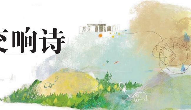
《亲爱的，你好，晚安》插图

正的诗人评价诗人，彼此心灵相通、惺惺相惜。尤其是关于苹果爷爷的部分，文字素朴隽永，令人动容，让我们对作品的故事背景有了更清晰的了解，便于孩子们理解和诵读。