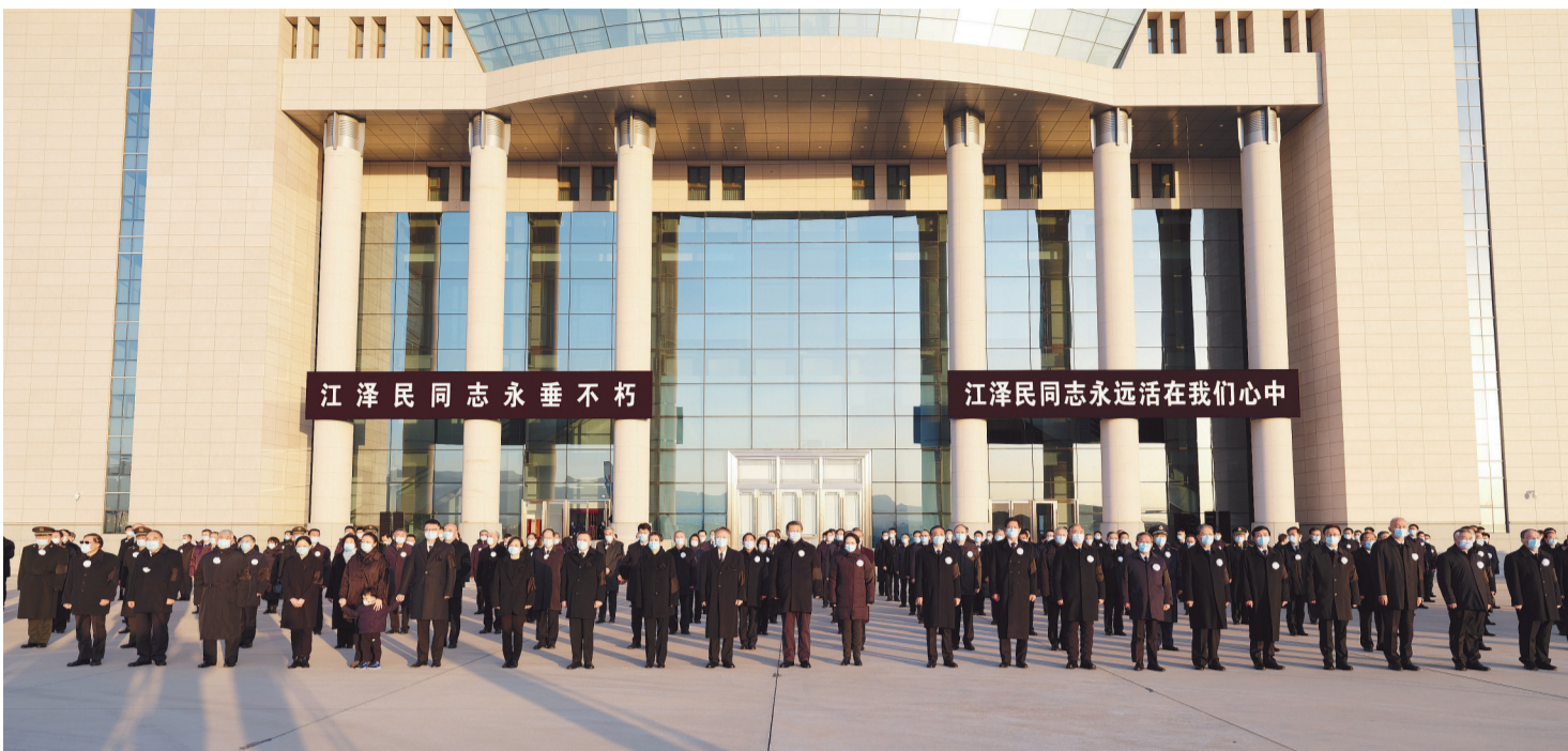
12月1日,江泽民同志的遗体从上海由专机敬移到达北京。习近平、李克强、栗战书、汪洋、李强、赵乐际、王沪宁、韩正、丁薛祥、李希、王岐山等党和国家领导同志到北京西郊机场迎灵。蔡奇等从上海护送江泽民同志遗体回到北京。